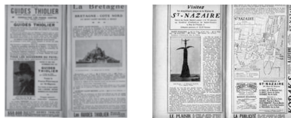
Figure 3 • Guides Thiolier (1934)

effort pour créer une connivence avec le lecteur par l'autodérision : " Les Guides Thiolier évitent les coups de fusil et servent d'armure " (p. 18).