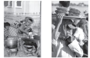
Figure 7 • Guide Gallimard

guide, elle vise davantage à renforcer la représentation (ethos) que donne le locuteur de lui-même : humaniste, esthète... Ainsi, reprenons le référent de la gastronomie dans le Guide Gallimard (Fève et Milledrogues, 2001, pp. 232 et 237), la partie "La cuisine cambodgienne" s'ouvre et s'achève sur deux photographies pleine page qui nous semblent dignes d'intérêt par leur taille, et leur position dans le discours : cette démarche nous permet de dégager des "passerelles" avec les discours présents dans la presse-magazine (cf. figure 7).