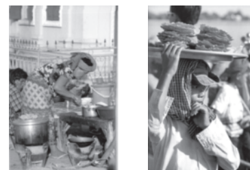
Figure 7 • Guide Gallimard

guide, elle vise davantage à renforcer la représentation (ethos) que donne le locuteur de lui-même : humaniste, esthète... Ainsi, reprenons le référent de la gastronomie dans le Guide Gallimard (Fève et Milledrogues, 2001, pp. 232 et 237), la partie "La cuisine cambodgienne" s'ouvre et s'achève sur deux photographies pleine page qui nous semblent dignes d'intérêt par leur taille, et leur position dans le discours : cette démarche nous permet de dégager des "passerelles" avec les discours présents dans la presse-magazine (cf. figure 7).