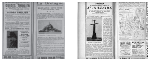
Figure 3 • Guides Thiolier (1934)

effort pour créer une connivence avec le lecteur par l'autodérision : "Les Guides Thiolier évitent les coups de fusil et servent d'armure" (p. 18).