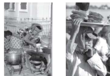
Figure 7 • Guide Gallimard

guide, elle vise davantage à renforcer la représentation (ethos) que donne le locuteur de lui-même : humaniste, esthète... Ainsi, reprenons le référent de la gastronomie dans le Guide Gallimard (Fève et Milledrogues, 2001, pp. 232 et 237), la partie "La cuisine cambodgienne" s'ouvre et s'achève sur deux photographies pleine page qui nous semblent dignes d'intérêt par leur taille, et leur position dans le discours : cette démarche nous permet de dégager des "passerelles" avec les discours présents dans la presse-magazine (cf. figure 7).