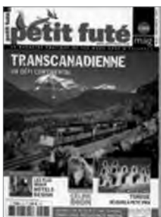
Petit Futé Mag (septembre-octobre 2010)