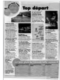
Femme Actuelle (9 au 15 août 2010)