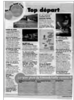
Femme Actuelle (9 au 15 août 2010)