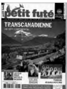
Petit Futé Mag (septembre-octobre 2010)