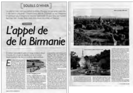
Le Nouvel Observateur (28 octobre 2010 au 3 novembre 2010)