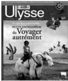
Ulysse (25 mars 2009)