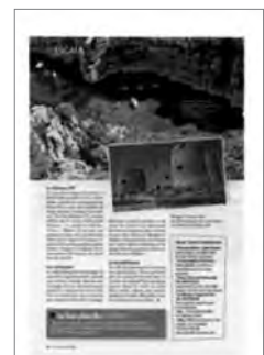
Vie Pratique (21 au 27 octobre 2010)