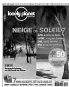
Lonely Planet Magazine France (nov. 2010)