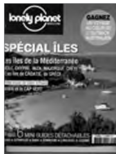
Lonely Planet Magazine n° 5 (juillet-août 2010)