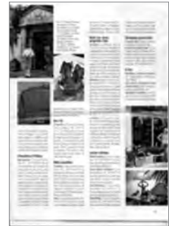
La Parisienne, supplément du Parisien (21 au 27 octobre 2010)