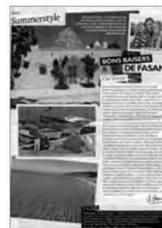
Le Nouvel Observateur (21 au 27 octobre 2010)