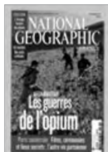
National Geographic (févr. 2011)

ces ruelles, comment va-t-on rentrer ?” ; “Pas de panique on n’a qu’à demander notre chemin à un de ces sympathiques Mexicains”) et se faire comprendre (“J’ai pris mon guide de conversation espagnol et en plus il y a la phonétique [...]”). Elle opère une distanciation par l’humour (“Buenos Dillasse !...quelle es el camino delle hotel estrela por favore ? [...]”).