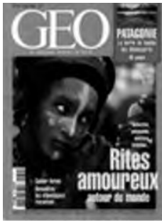
Géo (août 1998)