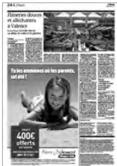
Le Monde (11 juin 2009)

relation avec le sujet de l’article. Par exemple, dans un texte paru dans Le Monde du jeudi 11 juin 2009, le référent est Valence alors que la publicité porte sur des villages clubs (cf. illustration 2). Dans Le Monde du 20 décembre 2008, l’article évoque Naples, mais la publicité l’Espagne (cf. illustration 3, 2 e partie).