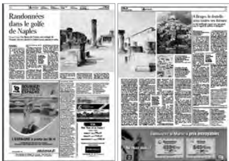
Le Monde (20 décembre 2008)