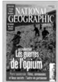
National Geographic (févr. 2011)

ces ruelles, comment va-t-on rentrer ?” ; “Pas de panique on n’a qu’à demander notre chemin à un de ces sympathiques Mexicains”) et se faire comprendre (“J’ai pris mon guide de conversation espagnol et en plus il y a la phonétique [...]”). Elle opère une distanciation par l’humour (“Buenos Dillasse !...quelle es el camino delle hotel estrela por favore ? [...]”).