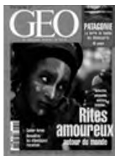
Géo (août 1998)