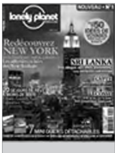
Lonely Planet Magazine n° 1 (nov.-déc. 2009)