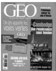
Géo Magazine (mai 2003)