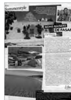
Le Nouvel Observateur (21 au 27 octobre 2010)