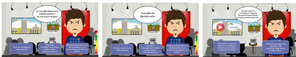
Séquence d’ouverture du chapitre 5. À noter la pression exercée sur le joueur dans l’image au centre. La jauge de niveau à droite de l’écran donne un feedback au joueur.

communication avec la situation qui est évaluée. La séquence d’ouverture du cinquième chapitre ci-dessous illustre bien l’interaction entre la situation, les réponses possibles et la jauge de niveau. Alors que nous incarnons un chargé de communication en faveur de l’enfouissement des déchets nucléaires, un militant nous aborde au cours de notre exposition sur le sujet. Les trois solutions qui s’offrent à nous représentent trois styles de communication : la première vise à apaiser la situation, la deuxième vise à affirmer notre avis de chargé de communication, et la dernière est plus radicale car elle nous conduit à éviter le dialogue. À noter la présence du pouce rouge en haut de la jauge de niveau qui indique ici non pas une perte de points mais une situation de stress. Il nous indique que la situation est tendue et que, malgré nos convictions personnelles ou notre tentation à vouloir éviter le débat, nous avons tout intérêt à choisir une des deux premières réponses. Si nous ne répondons pas dans les secondes qui suivent la question, le militant ajoute de la pression en disant « Vous allez me répondre enfin ! ».