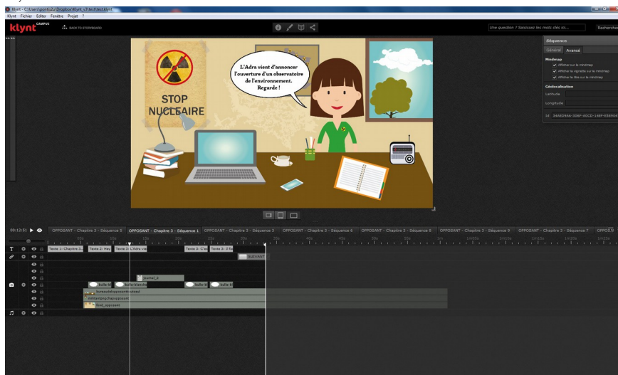
Interface de création de séquence. Les éléments sont directement importés dans l'aperçu au centre de la fenêtre. L'échelle de temps en bas de l'écran permet de définir l'apparition chronologique des éléments dans la séquence.

La popularité du webdocumentaire est telle qu'elle entraîne le développement d'une offre conséquente de services et de logiciels pour les concevoir (Dufflo, 2012). Parmi cette offre, le master Journalisme et médias numériques de Metz avait choisi Klynt . Son interface paraît familière à quiconque ayant déjà manipulé des logiciels de montage audiovisuel. Le webdocumentaire qui est conçu s'affiche au centre de l'écran sous la forme de séquences qui représentent les documents qui le composent (documents audio, vidéos, pages web, images, etc.). Ces séquences sont liées entre elles par des liens hypertextes. Il est ainsi possible de voir facilement dans à quelle partie du webdocumentaire se rattachent l'ensemble des contenus. Des panneaux à gauche et à droite de l'écran donnent accès à des fonctionnalités d'édition pour importer du contenu existant sur son ordinateur, insérer du texte, etc. À l'intérieur d'une séquence, plusieurs éléments peuvent s'enchaîner : le titre de la page peut apparaître, puis une image, ainsi qu'un lien hypertexte pour revenir à l'accueil par exemple. L'ordre et le temps d'apparition de ces éléments peuvent être définis dans une ligne chronologique ( timeline ).