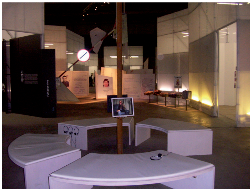
Illustration 2 : Exposition Retour de Babel : Itinéraires, mémoires et citoyenneté, ancienne aciérie de Dudelange, 2007

A la périphérie de Luxembourg, deux expositions majeures ont été installées, respectivement à Dudelange et à Esch-Belval. A Dudelange, Retour de Babel : Itinéraires, mémoires et citoyenneté (cf. illustration 2) mise sur une approche du thème des migrations, mettant en scène des habitants de la Grande Région Saar-LorLux, afin de susciter l'identification et de raconter, pour les publics locaux, une histoire incarnée de la région. Cette ambition de créer une exposition vitrine se