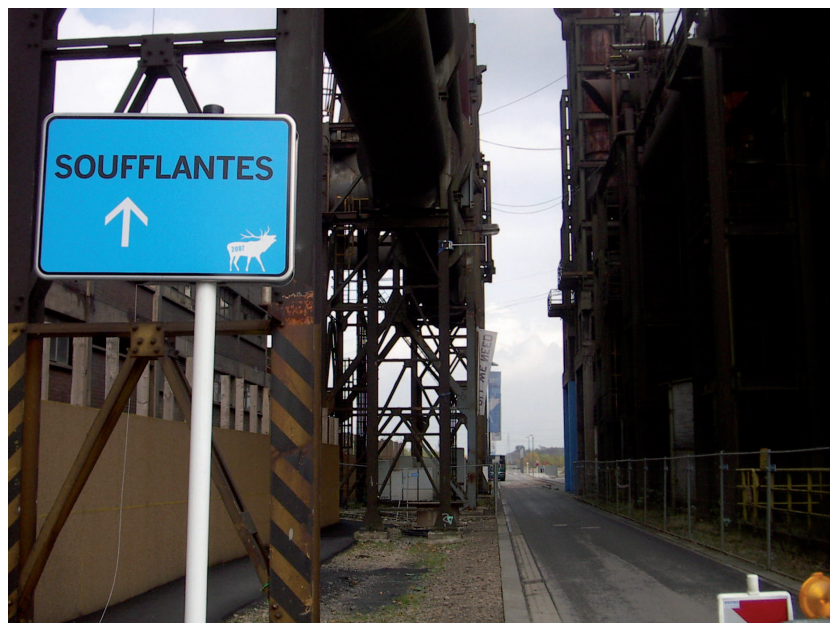
Illustration 1 : Le site des Soufflantes, Esch-Belval, 2007

puis dans la pérennisation du lieu, comme lieu d'accueil, soit d'exposition artistiques participatives visant un public plus proche, soit d'un public jeune local, qui y trouve, au fil d'une programmation éclectique, un nouveau lieu d'expression et d'identification. On retrouve une dichotomie semblable à l' Espace Paul Wurth entre les activités socio-culturelles attirant un public local dans ce quartier en transformation urbaine, et la relative désaffection pour les expositions photographiques, telle Hungry Planet , au discours plus ambitieux (sur la faim dans le monde) et visant un public plus global. On observe dans les deux cas une disjonction entre l'implantation, le contenu et les publics, disjonction qui limite l'impact de l'événement culturel et son appropriation par les publics de la Grande Région SaarLorLux en tant qu'expression culturelle apte à rassembler les publics.