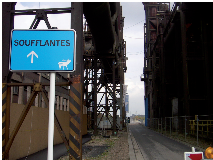
Illustration 1 : Le site des Soufflantes, Esch-Belval, 2007

puis dans la pérennisation du lieu, comme lieu d'accueil, soit d'exposition artistiques participatives visant un public plus proche, soit d'un public jeune local, qui y trouve, au fil d'une programmation éclectique, un nouveau lieu d'expression et d'identification. On retrouve une dichotomie semblable à l' Espace Paul Wurth entre les activités socio-culturelles attirant un public local dans ce quartier en transformation urbaine, et la relative désaffection pour les expositions photographiques, telle Hungry Planet , au discours plus ambitieux (sur la faim dans le monde) et visant un public plus global. On observe dans les deux cas une disjonction entre l'implantation, le contenu et les publics, disjonction qui limite l'impact de l'événement culturel et son appropriation par les publics de la Grande Région SaarLorLux en tant qu'expression culturelle apte à rassembler les publics.