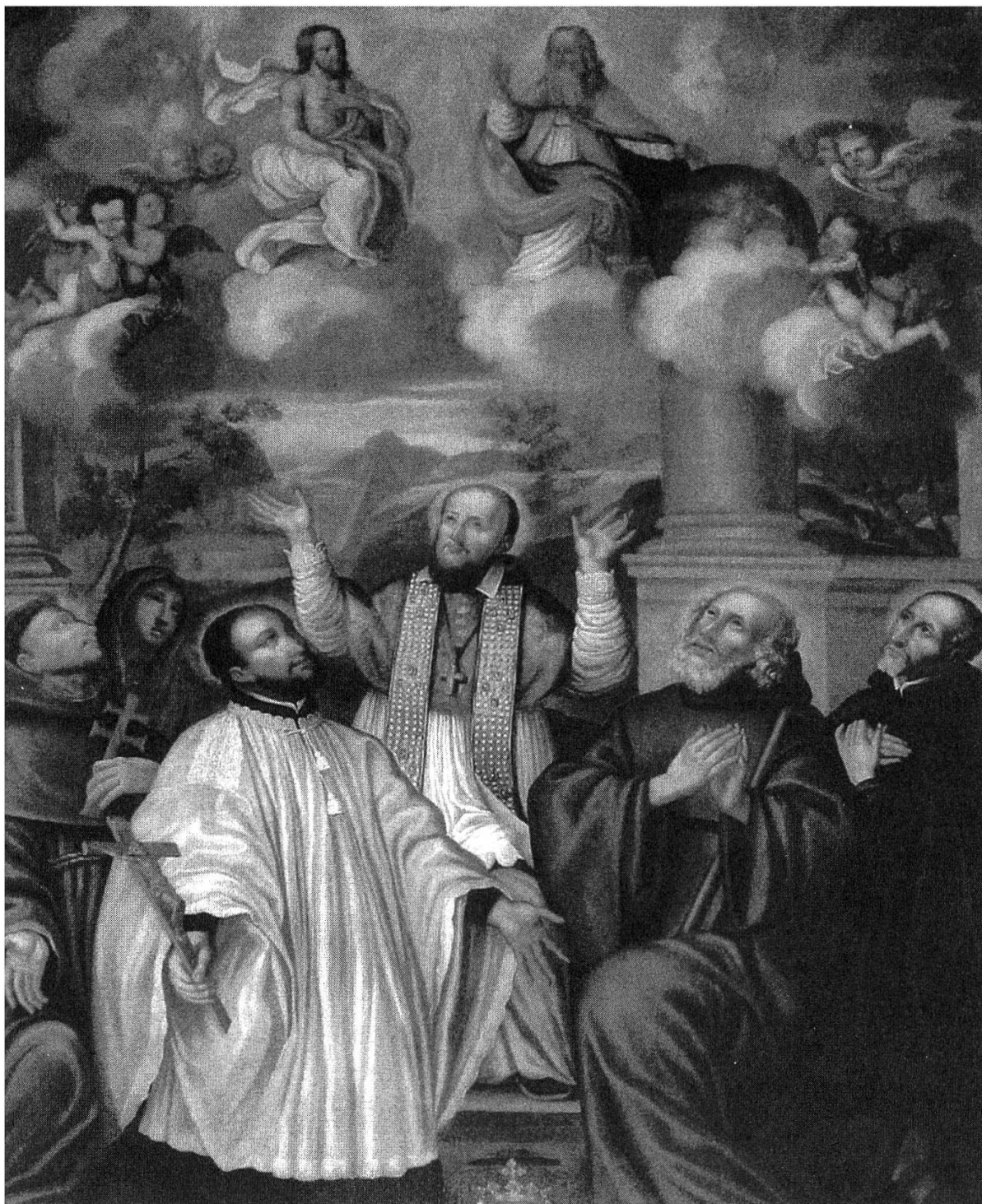
Fig. 1: Nicolas Oudéard, François de Sales et les fondateurs d'ordres. Moûtiers (Savoie), cathédrale. Huile sur toile (250 × 180 cm), 1673. Je remercie Madame Malbert-Curtil d'autoriser sa reproduction.