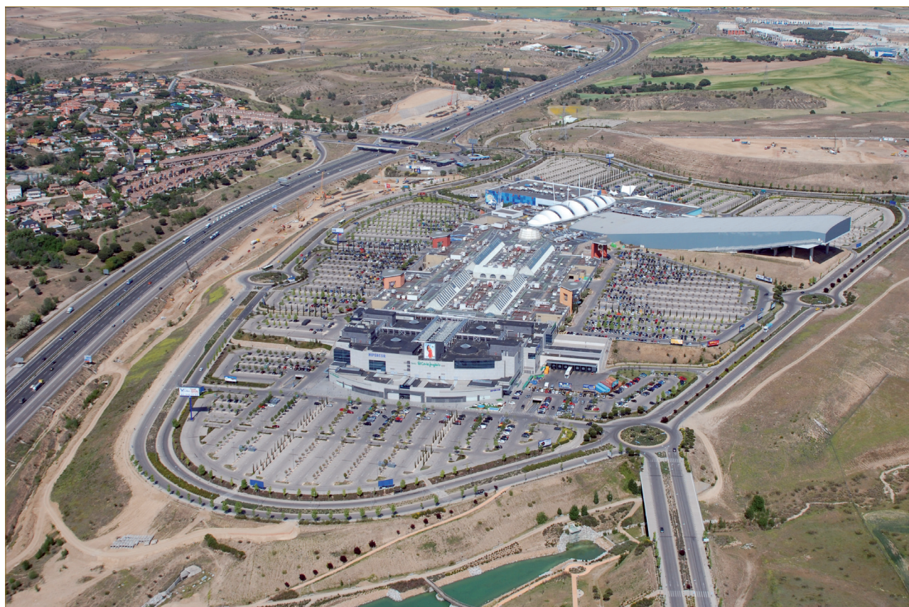
Figure 2 : Madrid Xanadú, vue vers le nord-est. (A. Humbert et C. Renard-Grandmon- tagne, 2009).

C'est dans cet environnement concurrentiel qu'a été conçu dès la fin des années 1990, autorisé, puis inauguré en mars 2003, le centre commercial de Madrid Xanadú, le plus grand centre commercial de l'aire urbaine de Madrid : 152 887 m 2 (surface SBA), 220 magasins, 9 500 places de parking. Situé le long de l'autoroute A5, en direction de Badajoz (Estrémadure), au kilomètre 23 (Fig. 2), Xanadú apparaît effectivement comme un kyste dans