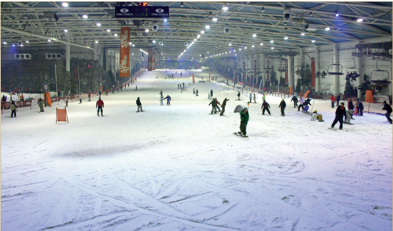
Figure 3 : Parque de nieve de Madrid-Xanadú (C. Renard-Grand- montagne, 2013).