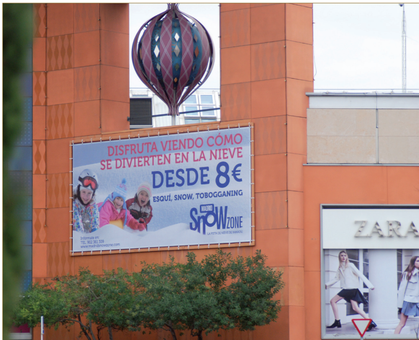
Figure 6 : Entrée principale de Madrid-Xanadú (C. Renard-Grand- montagne, 2013).

enfants et jeunes adolescents en famille ou en groupes. Cet intérêt particulier pour les jeunes peut constituer une stratégie commerciale à court et à moyen terme.