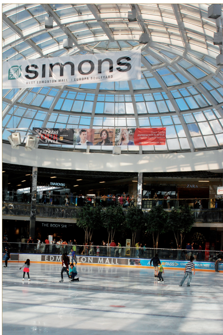
Figure 4 : Ice palace à West Edmonton Mall, (C. Renard-Grand- montagne, 2013).