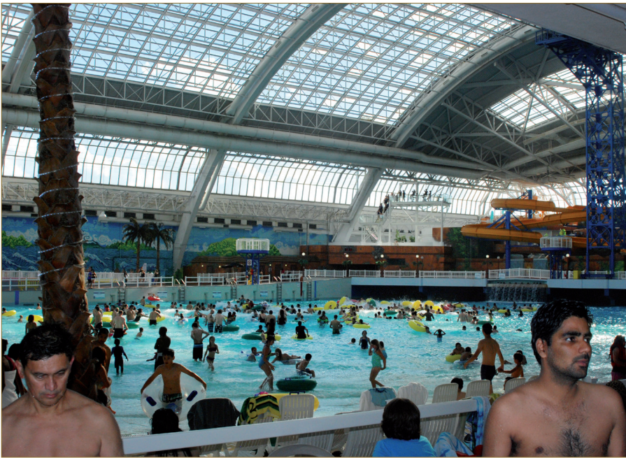
Figure 5 : Piscine tropicale à vagues, à West Edmonton Mall, (C. Renard-Grand- montagne, 2013).