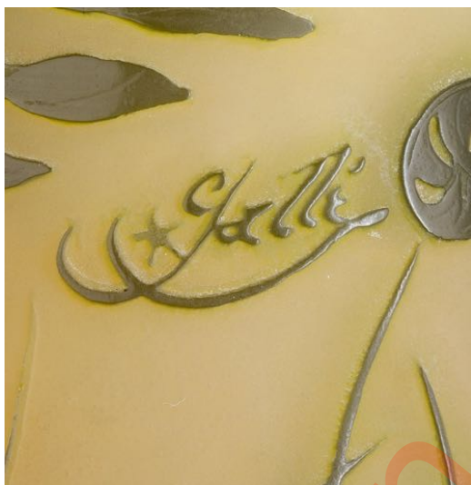
Figure 1. Marque-signature Gallé précédée d'une étoile, vers 1905-1908.