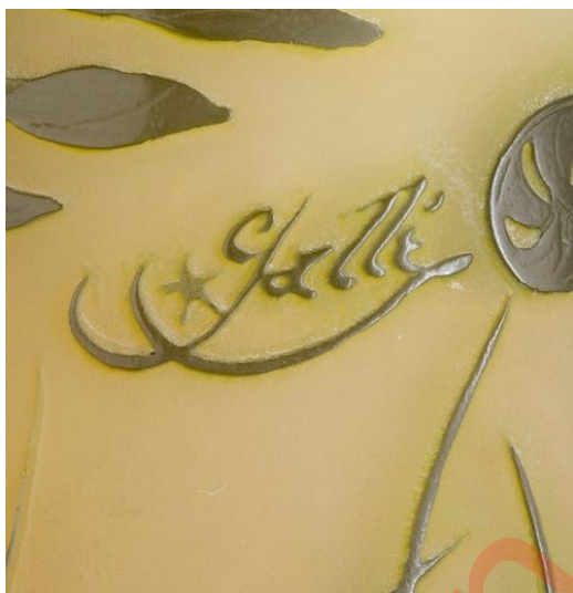
Figure 1. Marque-signature Gallé précédée d'une étoile, vers 1905-1908.