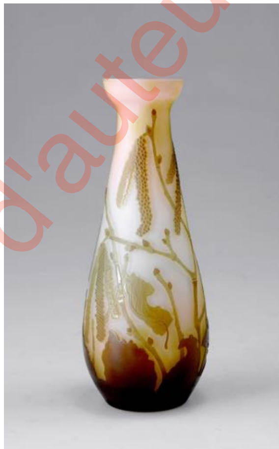
Figure 12. Vase à décor de chaton du noisetier (h. 20 cm), signature à l'étoile (Photo © Quittenbaum, lot 092 82).

Pour tenir compte des dates présumées d'introduction et de retrait de la marque à l'étoile, on peut prendre le résultat total de 1905 (en retenant l'hypothèse d'une introduction en janvier) mais retrancher 70% des ventes de 1908 (une estimation du résultat de juin-décembre). Le chiffre d'affaires total pour la cristallerie est alors de 1.775.000 F, soit, en conservant l'évaluation de 1904 de 34 F/pièce, une estimation alternative de 52230 cristaux vendus pendant la période de la marque à l'étoile. Cette production susceptible d'avoir reçu la nouvelle marque représenterait ainsi environ un peu moins d'un quart de l'ensemble des verreries industrielles vendues de 1901 à