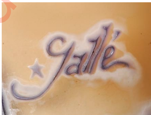
Figure 4. Marque-signature Gallé à l'étoile, é final, patronyme non souligné, vers 1905-1908.

L'histoire de la création et de l'utilisation de la marque Gallé à l'étoile a jusqu'à présent reposé uniquement sur l'étude des objets eux-mêmes, puisqu'aucun document contemporain n'est connu sur cette question. Immédiatement après la mort d'Émile Gallé, une signature particulière aurait été choisie par sa veuve parmi les centaines en usage, pour servir de marque unique, rappelant que les séries continuaient de procéder des recherches du maître verrier 6 . On la fit précéder d'une petite étoile ou astérisque, indiquant le caractère posthume de la production qu'elle authentifiait. La position et le dessin de cette étoile peuvent connaître de petites variations, mais elle précède le patronyme et elle est localisée en général juste au-dessus de