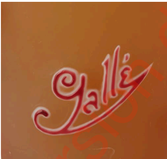
Figure 3. Marque-signature Gallé, vers 1918-1920.

de la cristallerie, ainsi qu'une croix de Lorraine, succède une standardisation qui en fait une véritable marque commerciale.