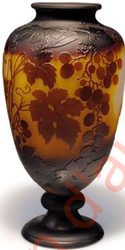
Figure 14. Vase à décor de vigne à l'automne (h. 34,5 cm), signature à l'étoile (lot 105A 133).