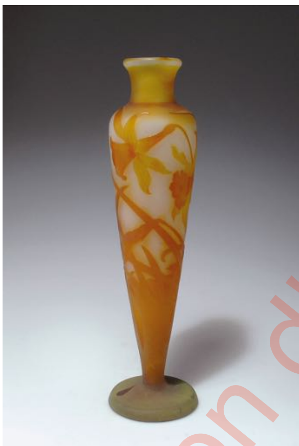
Figure 13. Vase à décor de narcisse (h. 35 cm), signature à l'étoile (Photo © Quittenbaum, lot 102 92).

1913, soit 223500 pièces — estimation obtenue par le même type de calcul à partir du tableau de répartition des ventes 46 . Ce pourcentage peut paraître bien élevé par rapport à l'ensemble des vases porteurs de la marque à l'étoile, mais il baisse rapidement une fois prise en compte la