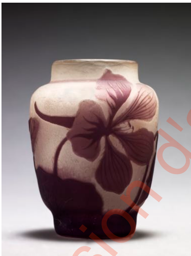
Figure 6. Vase à décor de clématites, signature à l'étoile, Musée de l'École de Nancy, inv. 003-0-27.

Elle ne fait toutefois pas entièrement l'unanimité car la signature à l'étoile se retrouve sur des vases dont la réalisation semble postérieure à 1906 : François Le Tacon, sans nul doute l'auteur qui a le plus étudié cette délicate question des signatures — et à qui notre étude doit beaucoup —, avait commencé par admettre sans réserve la datation 1904-1906 14 , avant d'introduire une nuance motivée par l'existence de ces vases manifestement plus tardifs. Il écrit ainsi en 1998 que « l'étoile disparaît en 1906 sur la plupart des vases. Elle sera cependant