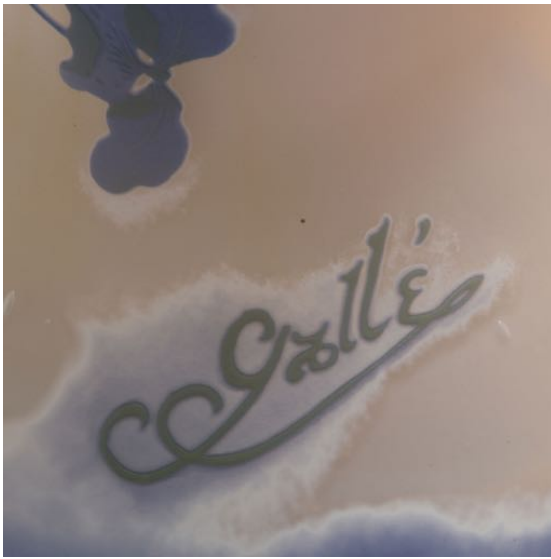
Figure 2. Marque-signature Gallé sans étoile, vers 1908-1914.