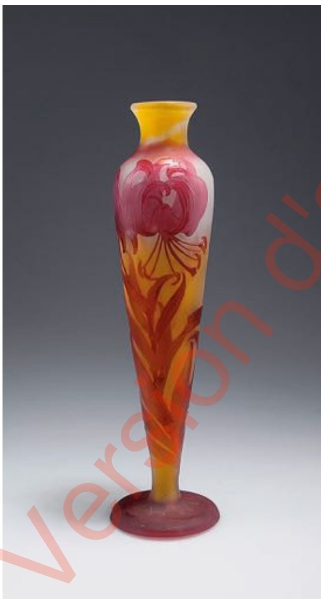
Figure 11. Vase à décor de lys des montagnes, signature à l'étoile (lot 108 71).

d'octobre 1904 à mai 1908, le dépôt a reçu approximativement 9500 lots, soit environ 38000 objets, cristaux et meubles confondus.