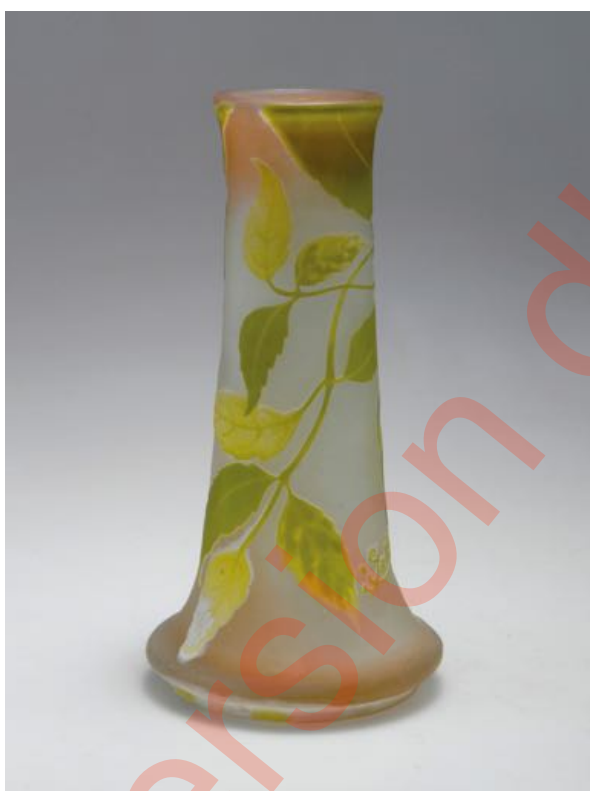
Figure 9. Vase à décor d'érable à feuilles de frêne (h. 24,5 cm), signature à l'étoile (Photo © Quittenbaum, lot 095 127).

L'hypothèse la plus probable est qu'aucune autre modification que la suppression de l'étoile n'est décidée en mai 1908 : la marque reste alors la signature choisie en 1905, avec le trait soulignant qui recoupe la jambe du G majuscule. C'est ce que suggère l'examen des séries qui sont datées de 1908-1909 grâce aux archives Daigueperce, comme la série des vases De par le roi du ciel , à décor de Jeanne d'Arc noire sur fond jaune 40 . De nombreuses séries, au décor