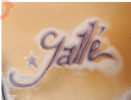
Figure 4. Marque-signature Gallé à l'étoile, é final, patronyme non souligné, vers 1905-1908.

L'histoire de la création et de l'utilisation de la marque Gallé à l'étoile a jusqu'à présent reposé uniquement sur l'étude des objets eux-mêmes, puisqu'aucun document contemporain n'est connu sur cette question. Immédiatement après la mort d'Émile Gallé, une signature particulière aurait été choisie par sa veuve parmi les centaines en usage, pour servir de marque unique, rappelant que les séries continuaient de procéder des recherches du maître verrier 6 . On la fit précéder d'une petite étoile ou astérisque, indiquant le caractère posthume de la production qu'elle authentifiait. La position et le dessin de cette étoile peuvent connaître de petites variations, mais elle précède le patronyme et elle est localisée en général juste au-dessus de