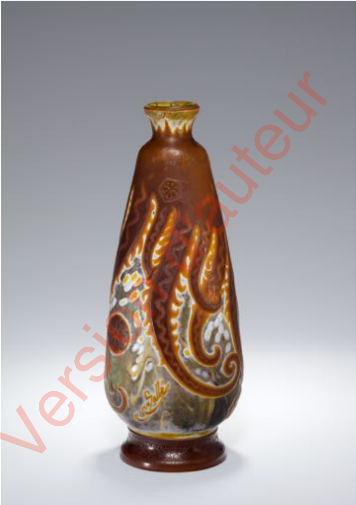
Figure 5. Vase à décor de pieuvre, signature à l'étoile (h. 25,4 cm, d. 9,5 cm), don d'Helmut Hentrich, Glasmuseum Hentrich, Dusseldorf, P 1975-126.