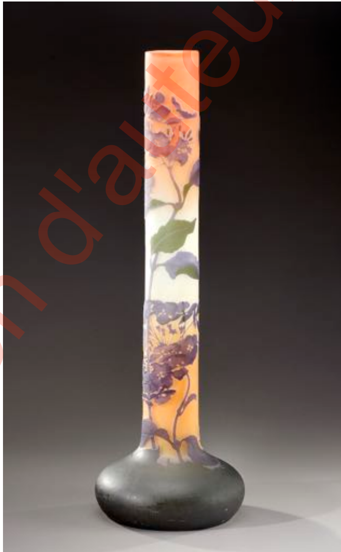
Figure 10. Vase à décor d'hortensia (h. 75 cm), signature à l'étoile, vente Aguttes du 13 avril 2012, lot 27-2/290.

Ces remarques permettent de rendre compte de la rareté relative de la marque à l'étoile de la façon suivante. Pour les grandes séries au succès commercial avéré, dont la production a pu commencer avant la fin de 1904 ou se poursuivre après mai 1908, voire traverser toute la période, la rareté s'explique par la faible proportion que représentent les pièces marquées à l'étoile par rapport au nombre total de