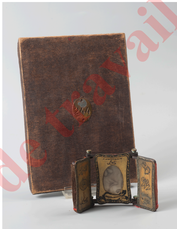
1. Triptyque petit modèle, portant la date 1904, accompagné de son coffret numéroté 244, catalogue de la vente Collin du Bocage, lot no 291, 27 mai 2016 (objet retiré de la vente). Un second triptyque du même type était présenté dans cette même vente (lot no 292), avec un coffret numéroté 299.

Il existe au moins quatre types différents de ces triptyques tous constitués de trois plaques de laiton et verre superposées, montées sur une armature de bois et articulées par des vis. Une exception à cette construction se présente sur une paire