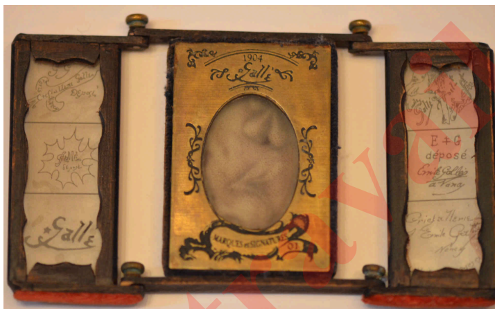
2. Triptyque du petit modèle, portant la date 1904, aux panneaux latéraux en verre et non en laiton, collection particulière.

Chaque type se décline ensuite en plusieurs modèles qui diffèrent par les signatures gravées sur les panneaux latéraux. Sur les panneaux de forme strictement rectangulaire, les signatures sont séparées par des lignes. Il semble bien qu'il n'y ait pas deux modèles identiques. Certains viennent dans une boîte cartonnée de présentation, doublée de velours bleu, et surtout portant sur le couvercle un numéro de série ajouré dans une plaquette métallique ovale – les numéros 220, 229, 244, 294 et 299 sont attestés. Certains types présentent