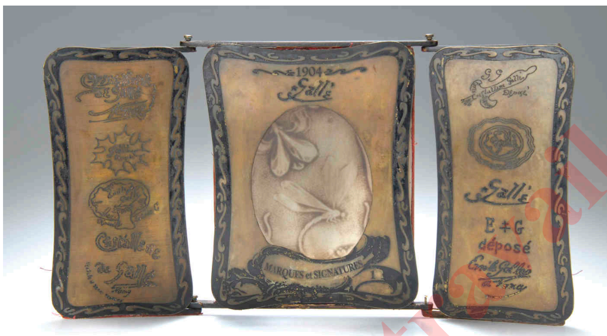
3. Triptyque grand modèle (face), portant la date 1904, aux panneaux latéraux en bois, catalogue de la vente Zezschwitz 55, lot no 354, 22 octobre 2009.