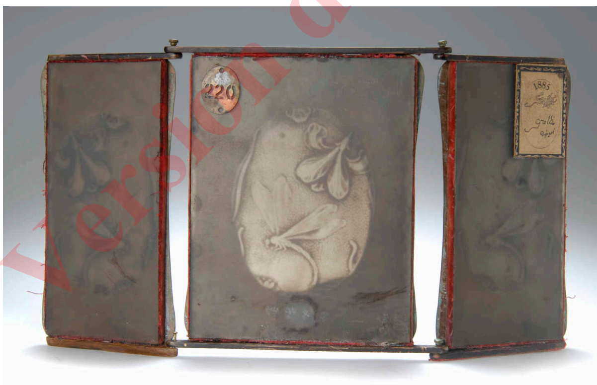
4. Triptyque du grand modèle (dos), portant la date 1904, aux panneaux latéraux en bois, catalogue de la vente Zezschwitz 55, lot no 354, 22 octobre 2009. L'étiquette numérotée 220 collée au dos du panneau central est la même que celles utilisées pour les coffrets de présentation, y compris la tache au-dessus du numéro. L'étiquette rectangulaire collée au dos du panneau gauche présente deux signatures inusitées au droit des panneaux, associées à la date 1885, alors qu'elles sont postérieures à 1894.