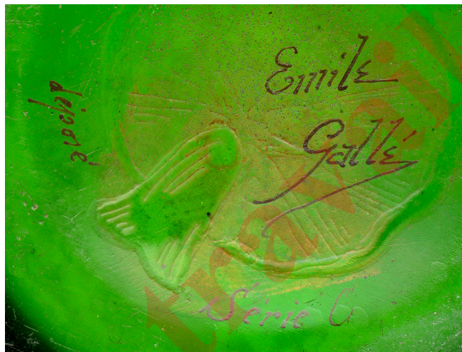
8. Variante de la signature n° 5, « Emile Gallé / déposé série C » au champignon, sur un vase à motif d'orchidées, vers 1900 : l'orientation du nom par rapport au champignon est très différente de celle observée sur la signature de la collection Buten.

Le succès relatif rencontré par ces faux auprès de collectionneurs témoigne que le faussaire a réussi à proposer un objet en partie crédible, malgré les nombreux problèmes qu'il soulève. Le soin particulier qu'il a apporté à utiliser des matériaux recyclés ou usés pour donner un aspect ancien à ces objets y est pour beaucoup : les vis des charnières sont oxydées, le bois patiné et éraflé, le velours des coffrets passé et les étiquettes de papier jaunies. Il a également fait preuve d'une certaine ingéniosité en s'inspirant probablement, pour les réinventer comme objet publicitaire au service d'une marque, de petits triptyques porte photos de bronze — le modèle exact reste à identifier. C'est vers 2007 que les premiers exemplaires de ces faux triptyques Gallé sont apparus sur le marché, notamment en Argentine 17 , où pourrait bien se trouver l'atelier de leur fabrication. Un faible coût de la main-d'œuvre et l'existence d'une tradition locale d'intérêt pour l'Art nouveau sont en effet deux conditions nécessaires : on ne s'expliquerait pas autrement cette entreprise. La date de leur fabrication est aussi probablement récente, car il a fallu attendre que l'intérêt pour les Gallé dépasse de beaucoup les