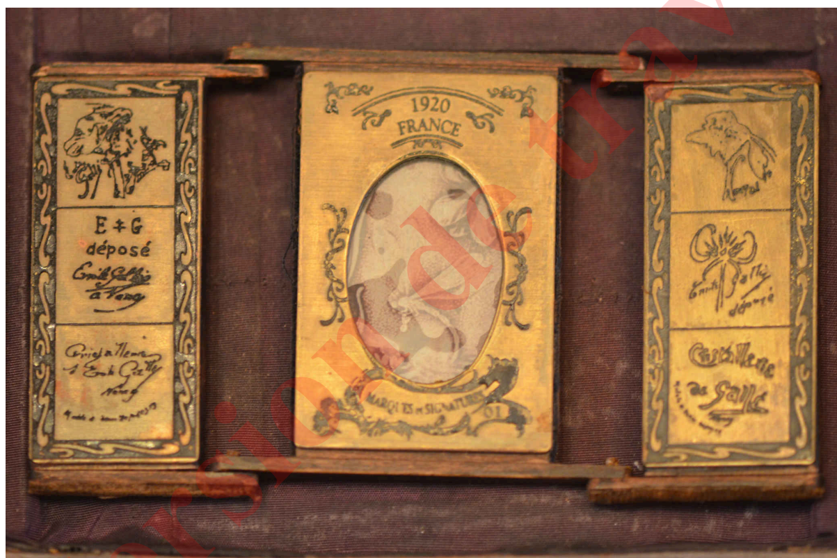
5. Triptyque du petit modèle, portant la date « 1920 France », sans la signature à l'étoile, mais avec la même mention « Marques et signatures 01 ». Ce triptyque pourrait correspondre au prototype des objets, modèle modifié par la suite en remplaçant cette mention par la signature et la date 1904. Collection particulière.