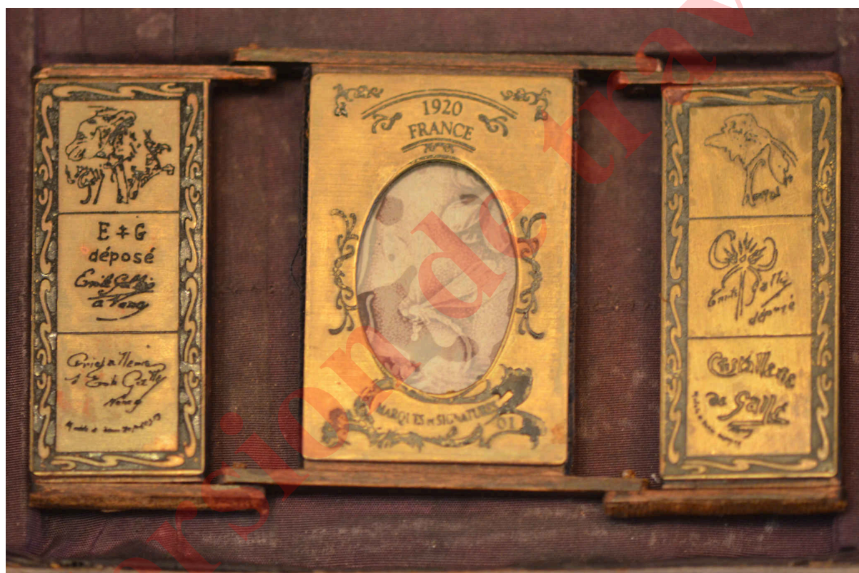
5. Triptyque du petit modèle, portant la date « 1920 France », sans la signature à l'étoile, mais avec la même mention « Marques et signatures 01 ». Ce triptyque pourrait correspondre au prototype des objets, modèle modifié par la suite en remplaçant cette mention par la signature et la date 1904. Collection particulière.