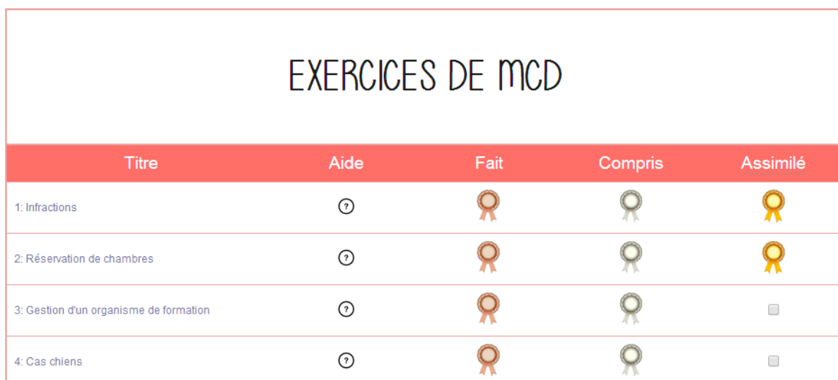
Figure 2 : Interface de mise à jour des apprentissages d'un étudiant

L'étudiant a devant lui un tableau avec la liste de tous les exercices regroupés par modules (MCD, SQL, Access). Au fur et à mesure de sa progression, il peut cocher les cases correspondant à son degré de complétude de l'exercice. Les médailles représentent les cases cochées. Sur cette capture, l'exercice 1 (Infractions) est terminé à 100% (fait+compris+assimilé) et l'exercice 4 (Cas chien) à 50% (fait+compris).