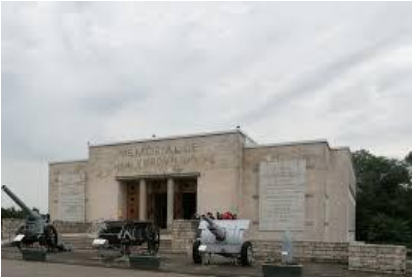
Mémorial de Verdun