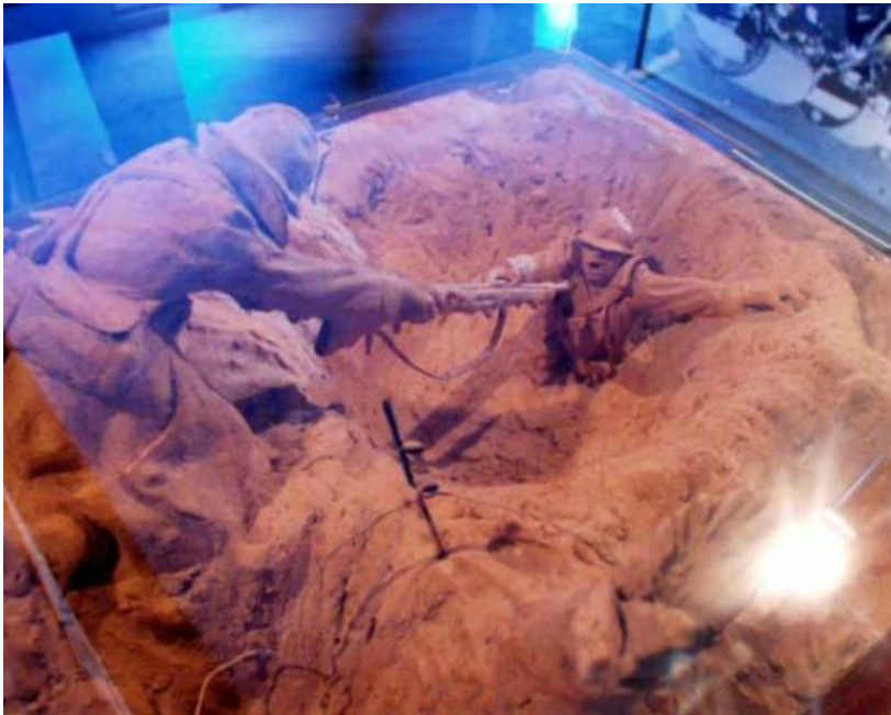
Reconstitution historique des tranchées