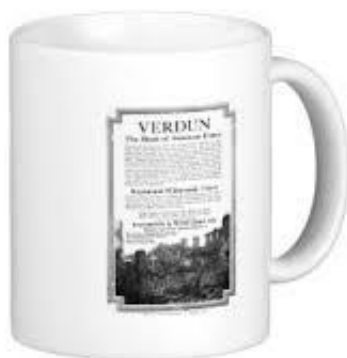
Mug 'annonce vintage de la visite de Verdun' commercialisé dans les années 2000