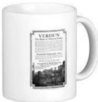
Mug 'annonce vintage de la visite de Verdun' commercialisé dans les années 2000