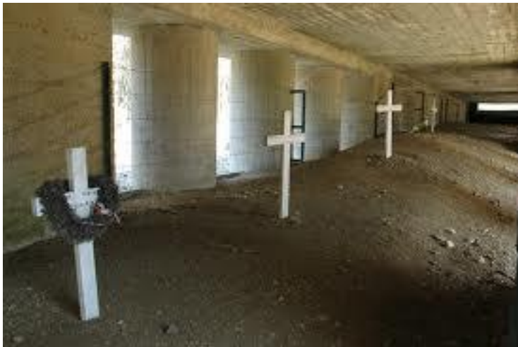
Tranchée des baionnettes