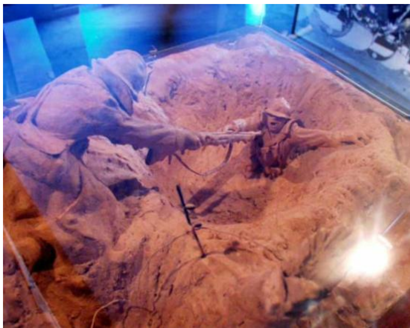
Reconstitution historique des tranchées