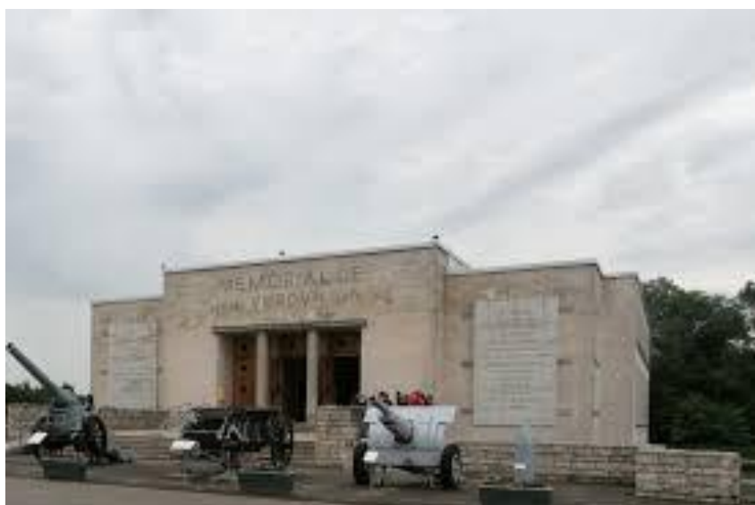
Mémorial de Verdun