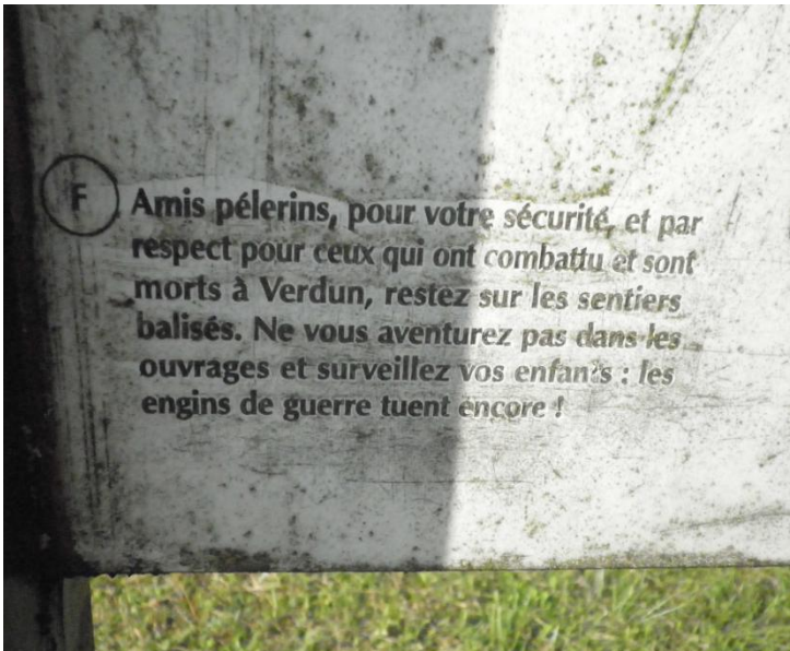
Exemple de panneau indicatif sur le champ de bataille