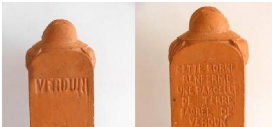
Borne de la voie sacrée commercialisée dès les années 1920