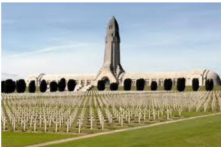
Ossuaire de Douaumont et sa Nécropole