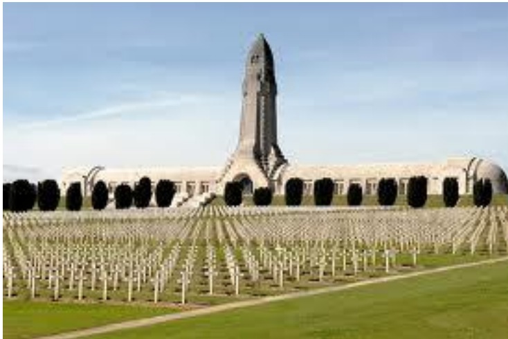
Ossuaire de Douaumont et sa Nécropole