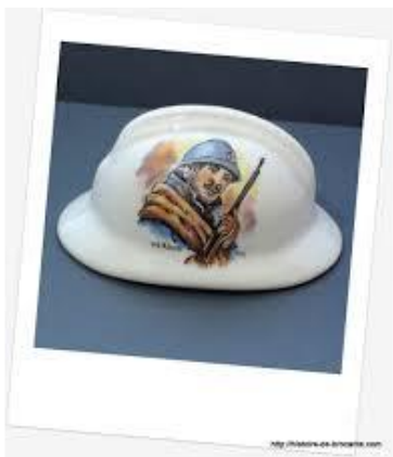
Casque en porcelaine représentant un poilu commercialisé dès les années 1950