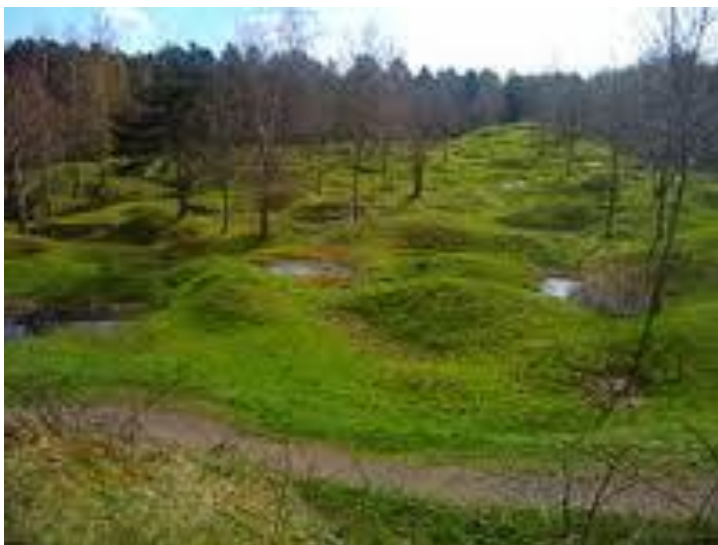
Forêt replantée sur le champ de bataille