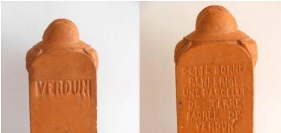
Borne de la voie sacrée commercialisée dès les années 1920