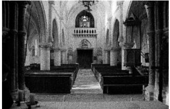
L'église de Fouchères-aux-Bois Vue intérieure. Revers de la façade. Région Grand-Est. Inventaire général.