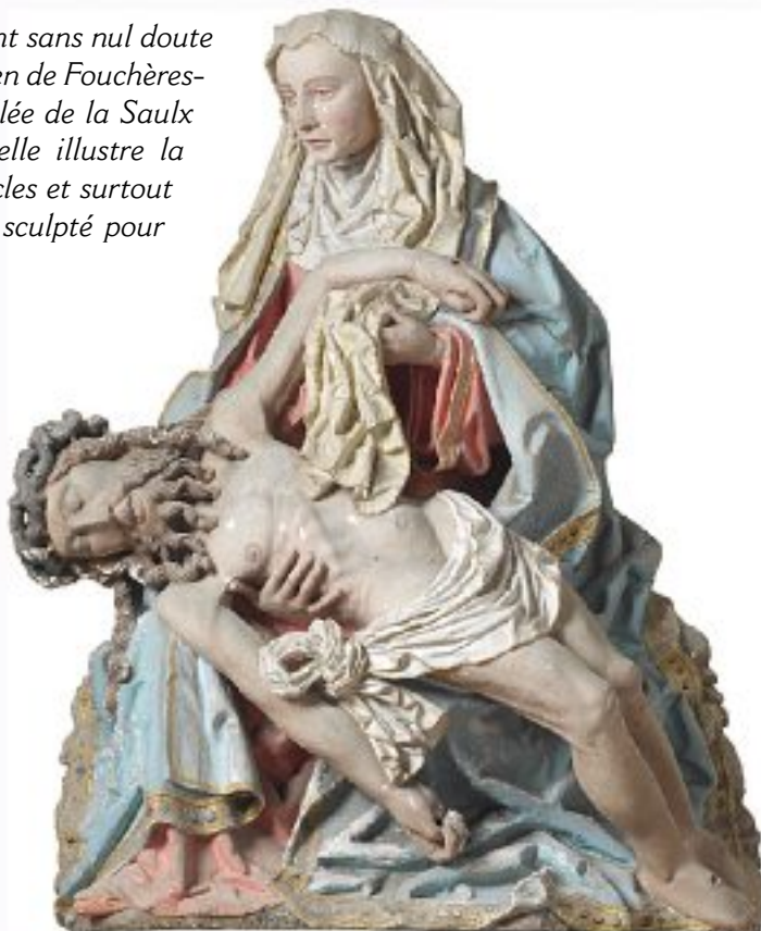
Vierge de pitié de Fouchères-aux-Bois.

L'analyse fait apparaître un trait particulier du travail de l'artiste : un souci de construction, de structuration de l'œuvre, peut-être accentué par la polychromie actuelle. Dans son premier plan, vue de face, la Pietà de Fouchères