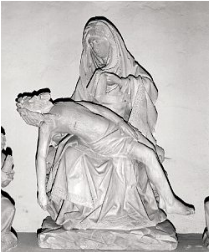
Vierge de pitié de Pont-Saint-Vincent. Région Grand Est-Inventaire général. Photo Jacques Guillaume.