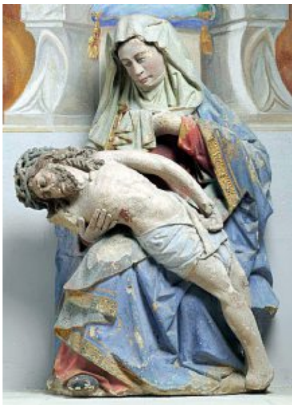
Vierge de pitié de Spada.