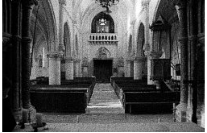
L'église de Fouchères-aux-Bois Vue intérieure. Revers de la façade. Région Grand-Est. Inventaire général.