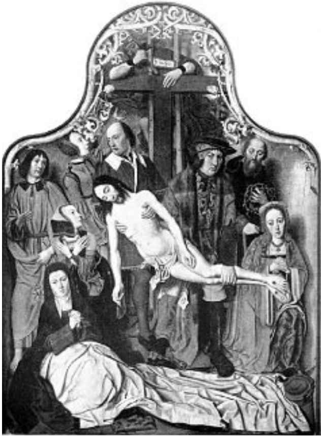
Jan Mostaert, Descente de croix. Panneau central d'un triptyque. Bruxelles, Musées royaux des Beaux-Arts

Pays-Bas. Jean Crocq, mort vers 1510, en était originaire. Une génération plus tard, vers 1520-1530, les mêmes courants méridiens continuaient d'exister. Fouchères semble en donner la preuve.