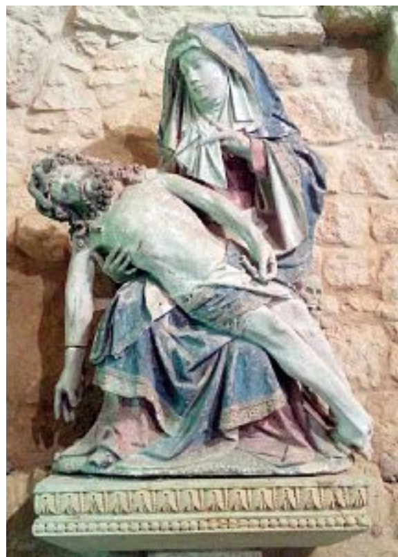
Vierge de pitié de Louppy-sur-Loison. Région Grand Est-Inventaire général. Photo Gérard Coing

Les caractères cités conduisent à associer la Pietà de Fouchères à cet ensemble de statues dont la localisation, enjambant les diocèses anciens de Lorraine, se trouve grosso modo correspondre à l'actuel département de la Meuse 19 . Il est datable des premières décennies du XVI e siècle et procède de l'influence de Jean Crocq. Aux détails signalés ci-dessus, on ajoutera la proximité des dimensions de ces œuvres, la position assez comparable du corps du Christ et le rôle dévolu au vaste manteau aux bords décorés. Le geste de Marie essuyant ses larmes en constitue comme le détail final et décisif.