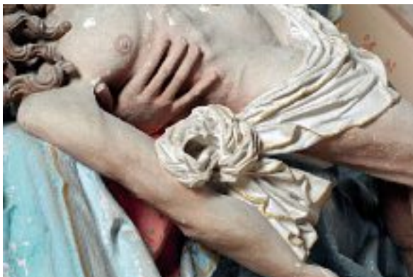
Vierge de pitié de Fouchères-aux-Bois. Le nœud du linge ceignant la taille du Christ.

On ignore l'histoire ancienne de cette statue. L'église de Fouchères, où elle est conservée au revers de sa façade, sur un socle de pierre, au-dessus du tambour de la porte 4 , a été reconstruite en style néo-gothique en 1869-1870, succédant à un édifice primitif peut-être fortifié. Avec d'autres statues plus récentes (un Saint Laurent, un Saint Maur, patrons de la paroisse), la Pietà en provient probablement.