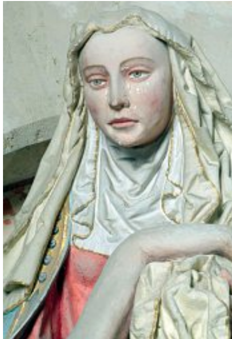
Vierge de pitié de Fouchères-aux-Bois. Le visage du Christ.