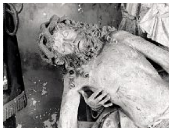
Vierge de pitié de Louppy-sur-Loison. Le visage du Christ. Région Grand Est-Inventaire général. Photo Gérard Coing

Toutefois, il reste clair que ces ressemblances ne peuvent mener à attribuer ces œuvres au même ciseau. Dans cette famille relativement diverse, le rapprochement le plus marqué avec notre statue se situe peut-être avec la Pietà de Louppy-sur-Loison 20 . Non pas pour le type de la Vierge, plus proche de Spada, non pas pour les plissés ou l'aspect donné au Christ, mais pour l'importance du visage de celui-ci, large, plus travaillé qu'ailleurs et surtout pourvu également d'une exceptionnelle pilosité. Les différences demeurent cependant sensibles.