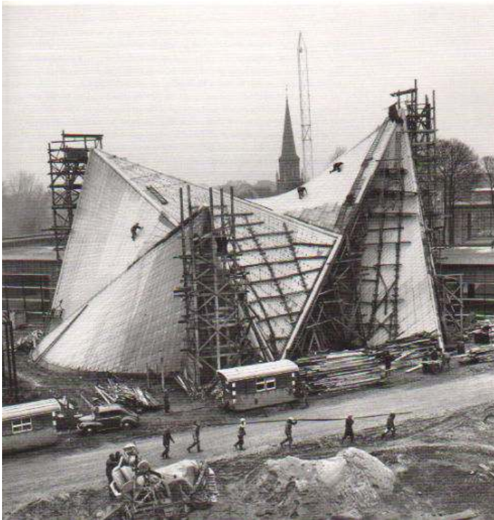
Le pavillon Phillips en cours de finition en 1958. Vivier, Odile, Varèse, Paris, Editions du Seuil, coll. « solfèges », 1987.