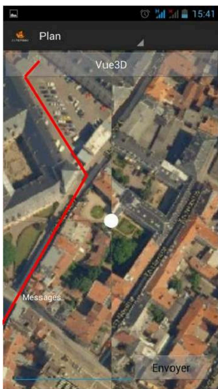
Application Alter Ego , parcours d'une étape