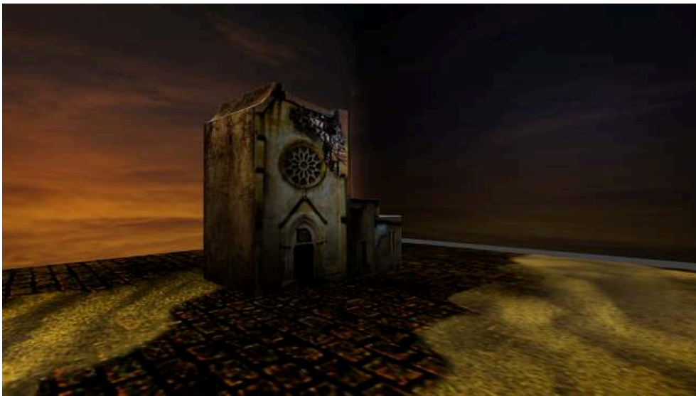
Application Alter Ego , Bâtiment des Trinitaires, Image 3D Donia Benharara, IUT de Saint-Dié