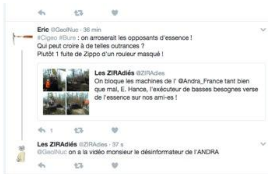
Figure 4. Dénonciation de la communication des opposants et réponse de ces derniers qui administrent la preuve de ce qu'ils affirment par leur extrait vidéo