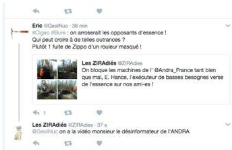
Figure 4. Dénonciation de la communication des opposants et réponse de ces derniers qui administrent la preuve de ce qu'ils affirment par leur extrait vidéo