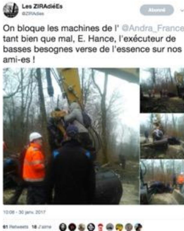
Figure 2. Capture d'écran d'un tweet d'opposants au projet Cigéo accusant un employé de verser de l'essence sur des individus.