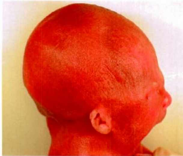
Figure II : Profil céphalique d'un fœtus après interruption médicale de grossesse pour arthrogrypose