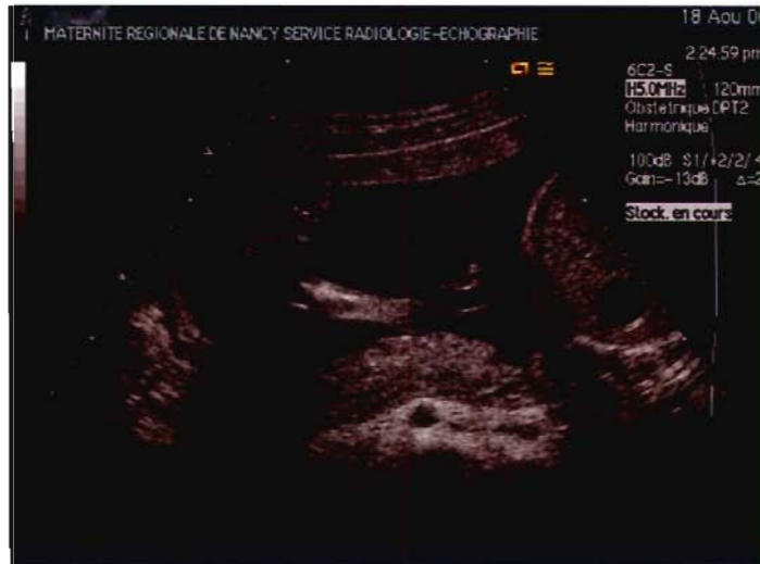
Figure IV : Pied bot