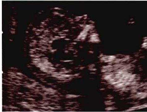
Figure V : Micrognathie

Une dysmorphie faciale avec parfois fente palatine est en rapport avec l'absence de mouvement de déglutition indispensables au modelage normal de la face.