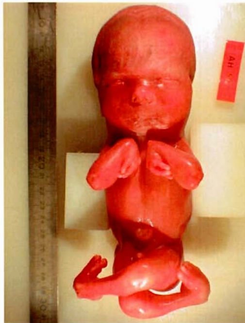
Figure III : Fœtus : corps entier après interruption médicale de grossesse pour arthrogrypose

L'enraidissement est souvent plus sévère au niveau des articulations distales que proximales. Il peut également affecter le rachis et l'articulation temporo-mandibulaire. Habituellement, les épaules sont en adduction-rotation interne, les coudes en extension plus souvent qu'en flexion, les poignets en flexion palmaire avec