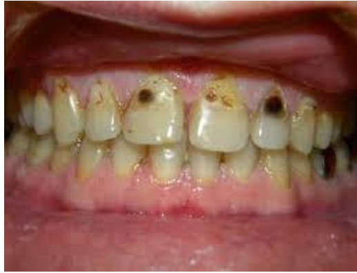
Figure 2 : photo intra-buccale révélant la présence de lésions carieuses cervicales au décours d'une hyposialie

source : http://www.moderndentistry.com.au/main-blog-2014-09-04-from-drooling-to-dry-mouth-and-everything-in-between