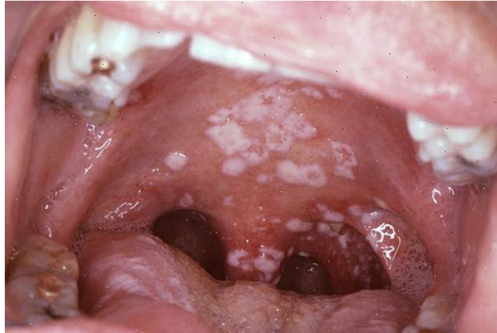
Figure 3 : photo intra-buccale mettant en évidence des lésions leucoplasiques palatines typiques d'une candidose buccale