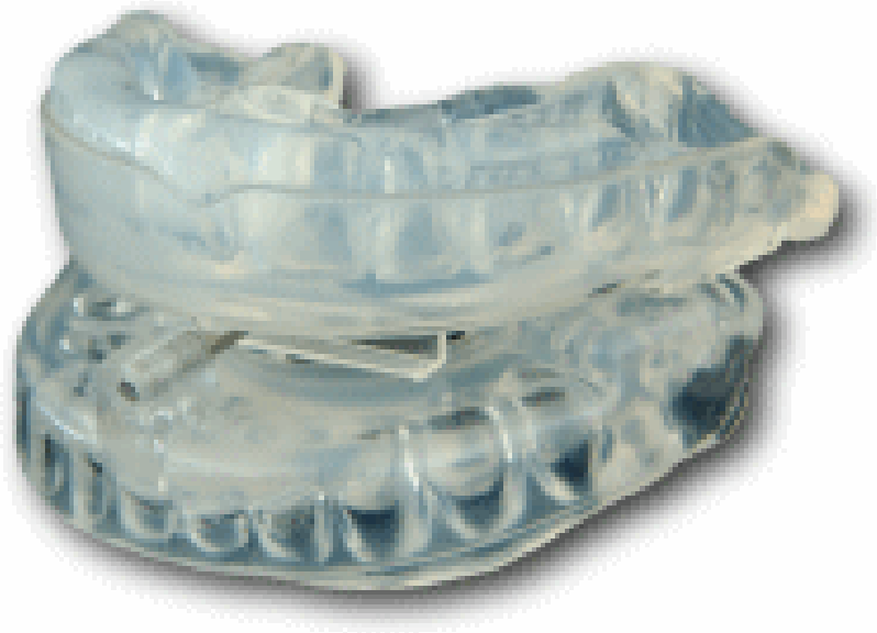
Figure 5 : exemple d'orthèse d'avancée mandibulaire