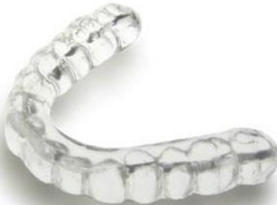
Figure 6 : exemple de gouttière occlusale thermoformée

http://www.bruxism.org.uk/shop/mandibular_advancement_devices/tomed_somnoquard_ap.php?PHPSESSID=fh91orkb57qibbq7vhofa8d300