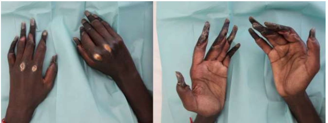
Figure 2 Nécrose digitale sèche de tous les doigts avec ulcération des 2ème et 3ème MCP bilatérales