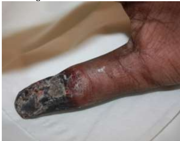
Figure 4 Nécrose sèche du pouce gauche avec pourtour inflammatoire