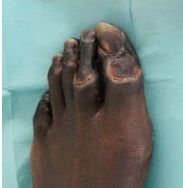
Figure 3 Nécrose sèche des orteils.