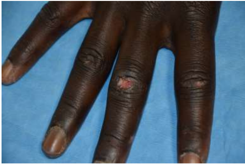
Figure 1 Ulcération en regard de la 3ème IPP de la main droite