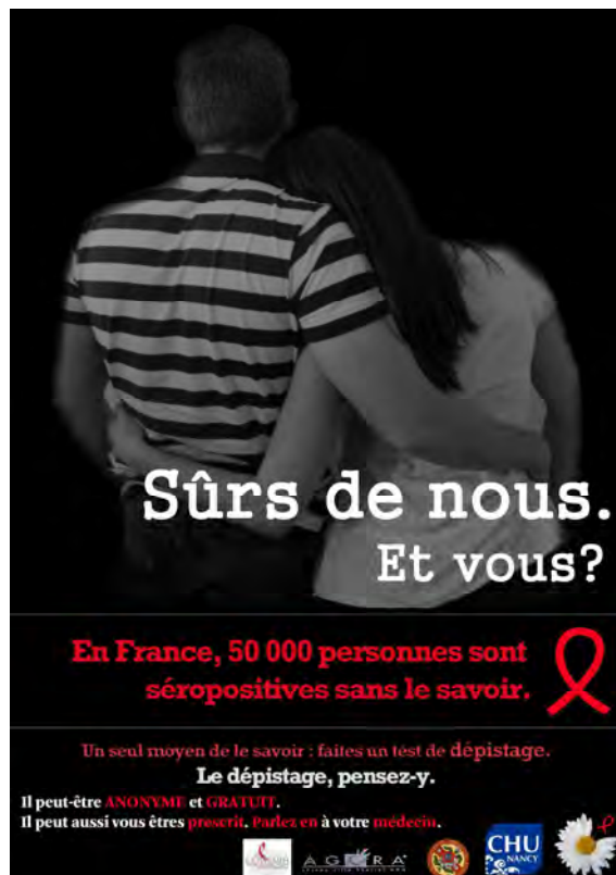
Affiches publicitaires réalisées par les élèves de PCEM2 2010-2011, option Prévention des IST.