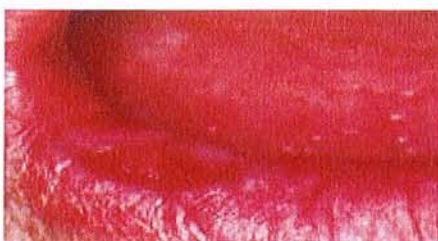
[28] [Scully C – Flint S]

Elles est souvent associée à une maladie cœliaque. Les lésions buccales commencent comme des vésicules qui se rompent pour laisser des ulcérations non spécifiques, comme ici sur le vermillon labial :