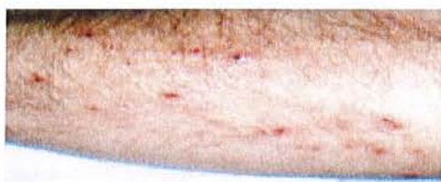
[28] [Scully C – Flint S]

L'éruption typique de la dermatite herpétiforme est très prurigineuse et consiste en de multiples vésicules tendues sur les coudes, les épaules et les autres zones d'extension. Cette figure montre des vésicules ouvertes :