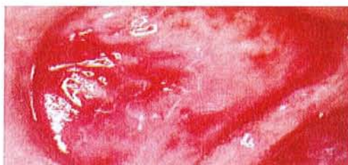
[28] [Scully C – Flint S]

Une ulcération buccale superficielle est l'une des manifestations de la maladie de Dühring mais quelques malades ont aussi des plaques de kératose :