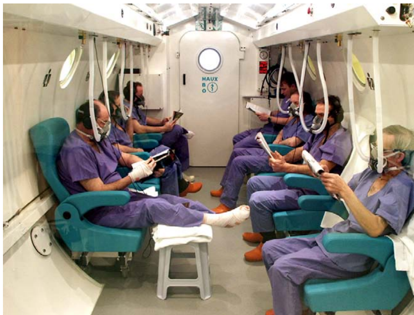
Figure 3. Séance d'oxygénothérapie hyperbare à l'HIA Legouest

En France, l'utilisation de caisson hospitalier monoplace est interdite pour des raisons de sécurité avec impossibilité de porter secours rapidement. Les patients respirent l'oxygène pur de façon intermittente avec un dispositif spécial tandis que le personnel accompagnant respire de l'air ambiant. Personnel et patients sont amenés progressivement à des pressions supra-atmosphériques.