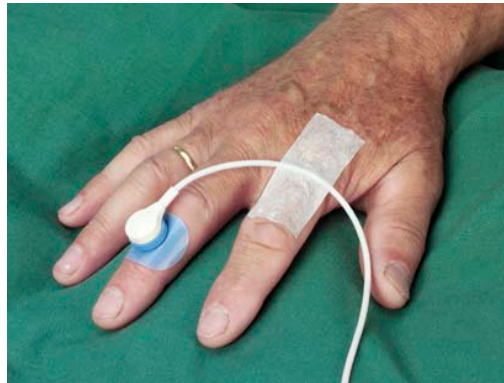
Figure 2. Mesure de la PtcO 2 par une électrode à oxygène

La détermination objective de l'effet de l'oxygénothérapie hyperbare sur l'oxygénation tissulaire peut se faire à l'aide de la pression transcutanée d'oxygène ou PtcO 2 (15) et informe sur le pronostic. Elle permet également de mesurer une évolution de la vascularisation périphérique. La vasodilatation des capillaires entraîne une augmentation de la taille des pores cutanés avec majoration de la perméabilité de l'oxygène à travers la couche cornée ce qui permet de mesurer la PtcO 2 par une électrode à oxygène.