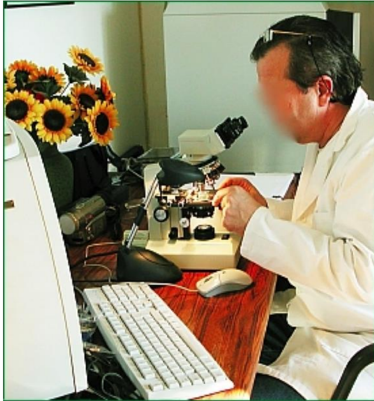
Figure 4 : Aspect scientifique