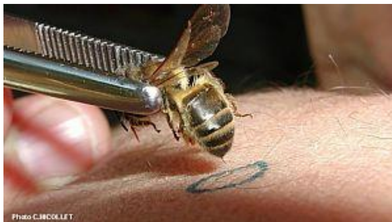
Figure 1 : Exemple d'apipuncture