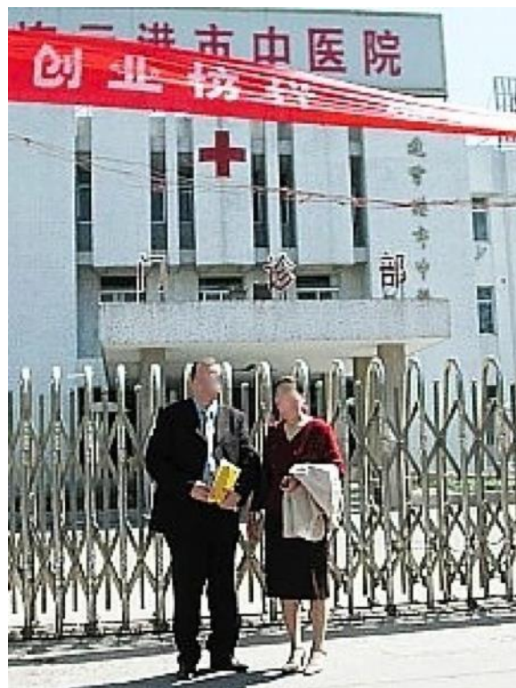
Figure 3 : Formation médicale à l'étranger

Port d'une blouse blanche, planche de corps humains en second plan, littérature abondante.