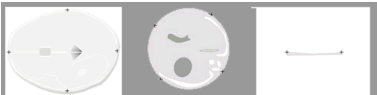
Figure 1 – Plans de coupe de référence pour les principales mesures de la biométrie fœtale (schémas extraits du CTE de 2005 [8])

La fiabilité de la biométrie fœtale suppose le respect des techniques de mesure afin de limiter la variabilité intra et interobservateur. Ces mesures doivent donc être réalisées dans les plans de coupe de référence, en respectant des points de repères précis, afin d'en améliorer la reproductibilité.