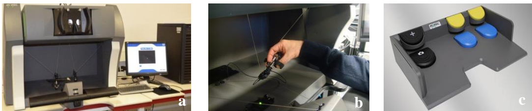
Figure 1: dV-Trainer® console (a), manipulateur (b), et pédalier (c)

Par ailleurs, un outil de mesure des performances, M-Score®, est inclus dans le simulateur. Onze critères de jugement sont évalués : la durée de réalisation, l'économie de mouvement, le lâcher d'objet, les collisions des instruments, la force excessive, le temps avec les instruments hors du champ de vision, l'ergonomie de l'espace de travail, les cibles manquées, les pertes sanguines, les traumatismes des vaisseaux, l'utilisation inappropriée de la coagulation. A partir de ces 11 paramètres, un algorithme calcule automatiquement un score global pour chaque exercice, exprimé en pourcentage.