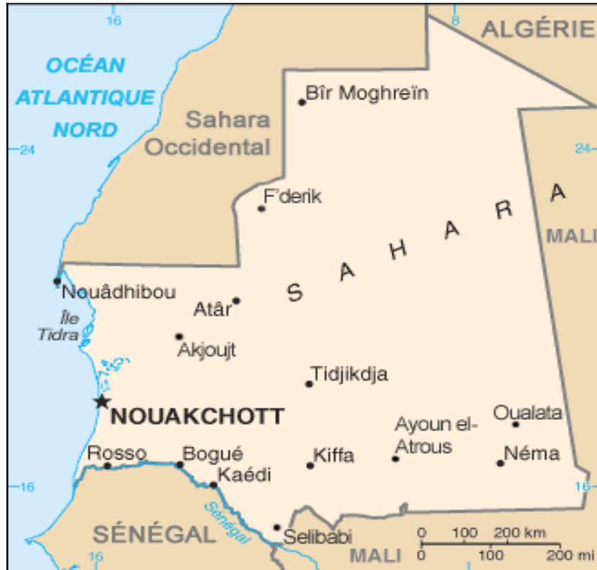
Carte de la Mauritanie

La République Islamique de Mauritanie est un vaste pays de 1.030.700 km 2 , recouverte au trois quart par l'espace désertique saharien, avec une population estimée à 3.250.000 habitants en 2009 dont 50% de femmes environ. La densité de la population est l'une des plus faibles au monde, avec environ trois habitants au km 2 . La population s'est fortement urbanisée aux cours de ces dernières années (50%), dont 25% est actuellement concentrée dans la capitale, Nouakchott. Cinq langues (ou dialectes) sont principalement parlées sur le sol mauritanien :