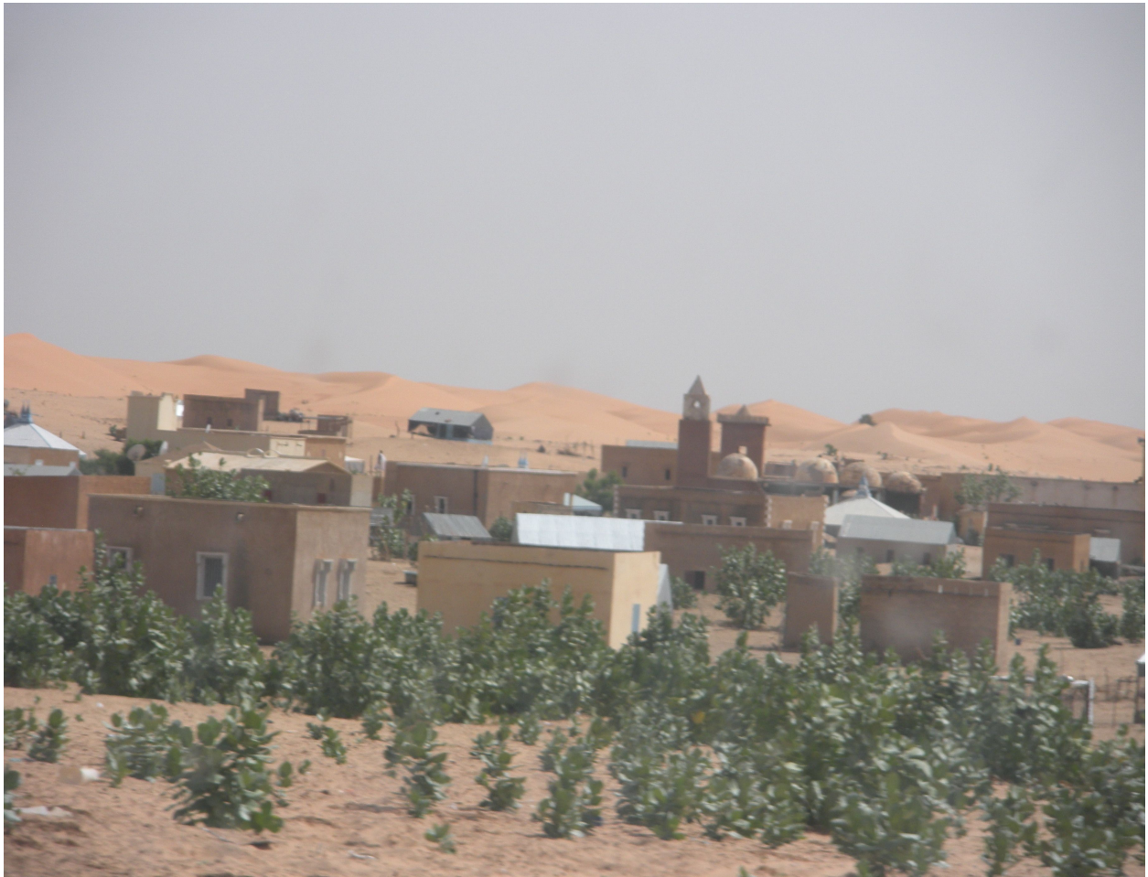
Village mauritanien le long de la route Nouakchott-Kaédi