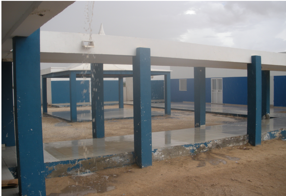
CTA de Nouakchott