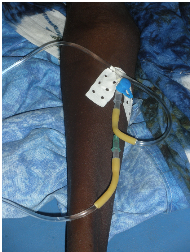
Système de perfusion à double entrée