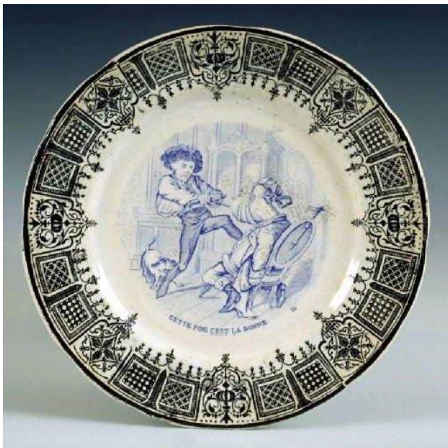
Figure 4. Assiette historiée (musée de la faïence) : manufacture de Sarreguemines.