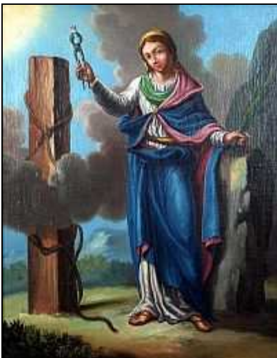
Figure 5. Représentation de Sainte Apolline : Auteur inconnu.

Sainte Apolline est dans la religion catholique la sainte patronne des dentistes.