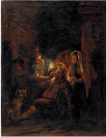
Figure 3. "L'arracheur de dents". XVIIème siècle : auteur anonyme (musée des Beaux Arts de Dole).