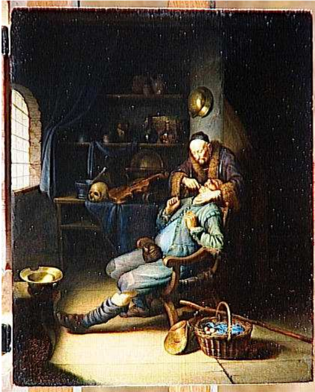
Figure 2. "L'arracheur de dents". XIXème siècle: DOU Gérard.

Revenons vers A. Paré pour étudier sa conception de la dentisterie conservatrice. Il a toujours recours à des recettes médiévales du type : «une gousse d'ail cuite sous les cendres, vous la mettez sur la dent le plus chaudement que vous pourrez endurer et mettez en aussi dedans l'oreille» . Il est également convaincu des propriétés analgésiques de l'urine et des «excréments de beste» .