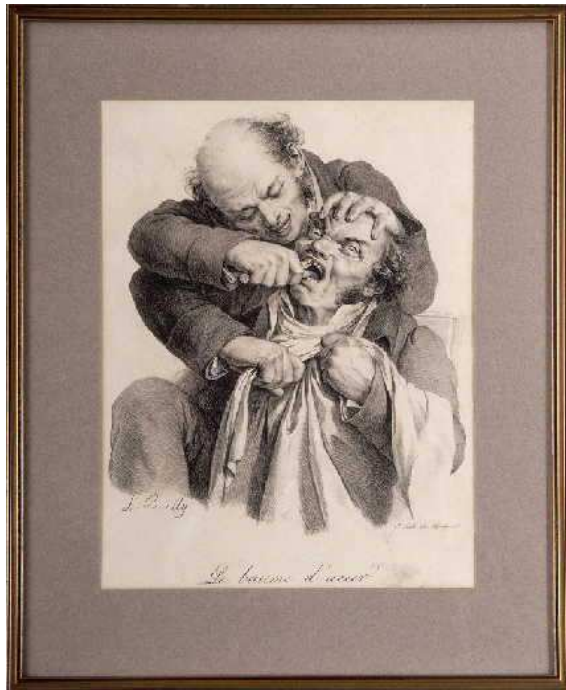
Figure 1. "Le baume d'acier". XIXème siècle: BOILLY Louis.

«... Véritablement, il faut être bien industriel à l'usage des pélicans, à cause que si on ne s'en sait bien aider, on peut faiblir à jeter trois dents hors la bouche, et laisser la mauvaise et gastée dedans...»