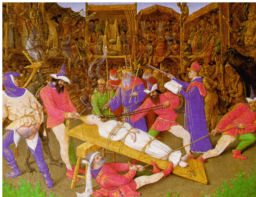
Figure 6. Le mystère de sainte Apolline : Jean Fouquet.

Outre le fait de présenter l'extraction des dents comme un martyre d'autant plus épouvantable que la victime est jeune, belle et innocente, cette histoire a suscité de nombreuses représentations plastiques d'un intérêt immense pour l'historien parce que témoignant de l'évolution de la forme du davier et de la technique d'extraction à travers les siècles.