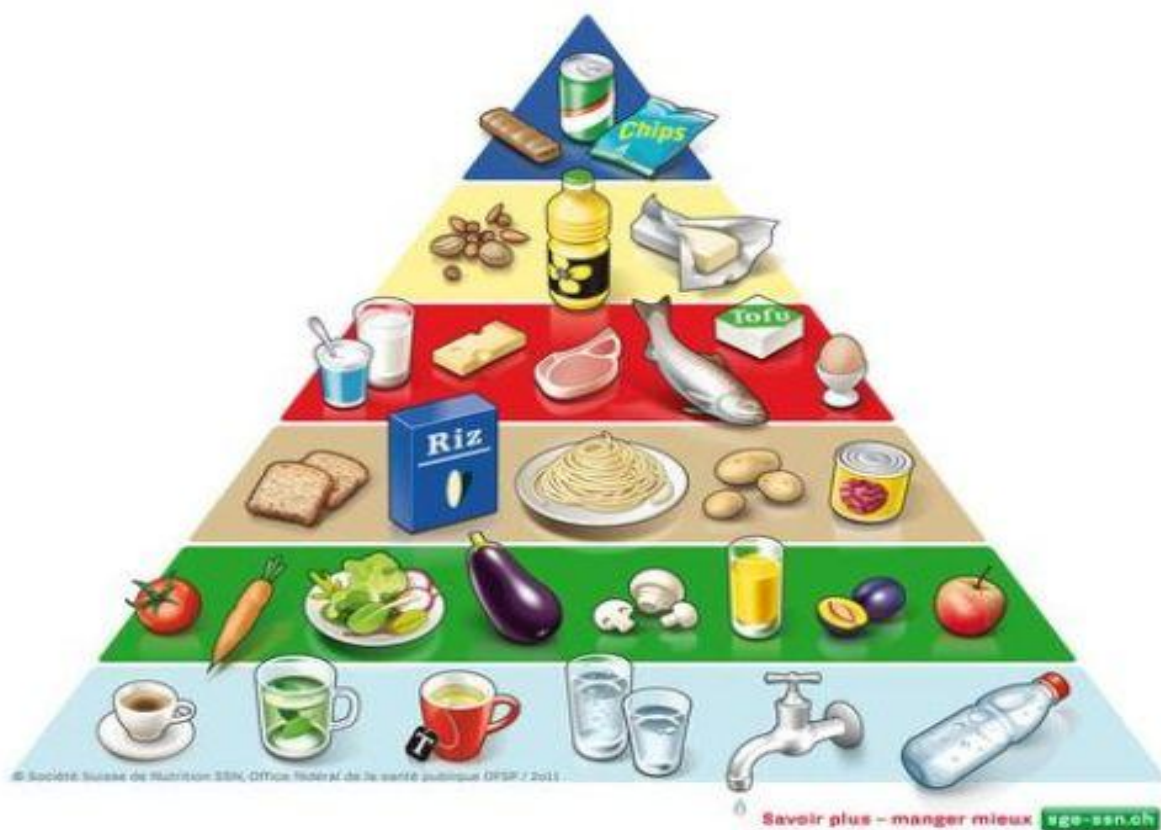
Fig. 1. Pyramide alimentaire. [133]

Ces recommandations permettent d'obtenir des apports suffisants en énergie, ainsi qu'en substances nutritives et protectrices.