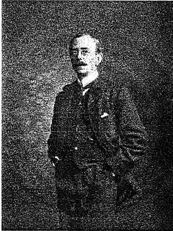
Sir Charles Scott SHERINGTON