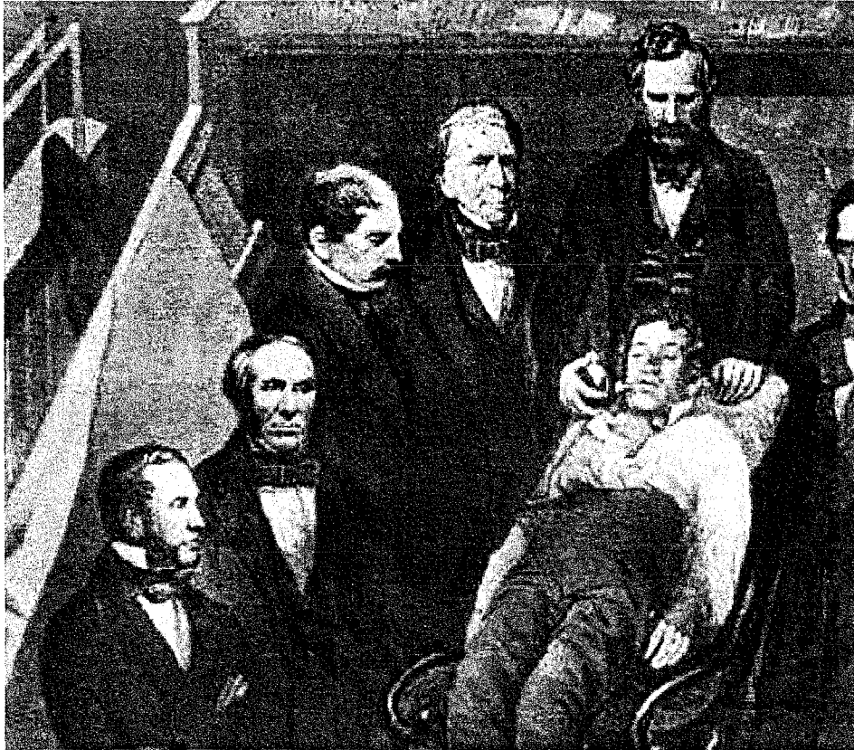
Démonstration d'anesthésie générale par MORTON au Massachusetts General Hospital