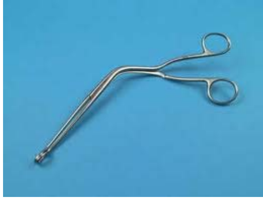
Pince de Magill

Il est important de noter que la manœuvre de Heimlich ne doit être tentée qu'en cas de certitude absolue d'une obstruction complète des voies aériennes. Une telle tentative dans un tableau d'obstruction partielle pourrait aggraver la gêne respiratoire.