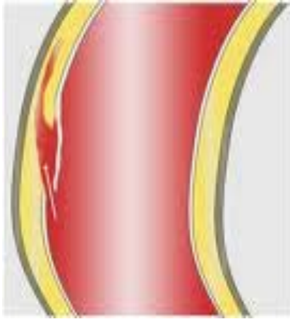
schéma selon J. Heuser.

Dissection aortique : on voit ici la progression antérograde du faux chenal à l'intérieur de la média