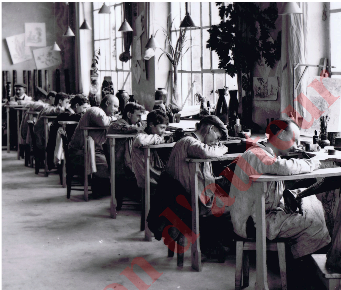
Fig. 3. Anonyme, Apprenti décorateur au travail dans l'atelier de décor sur verre, vers 1912, détail d'une photographie anonyme, tirage papier d'après une plaque de verre, collection particulière.

fortune de visiter ces ateliers, sous la conduite du gendre d'E. Gallé, le distingué professeur Perdrizet, de voir avec quelle conscience, avec quelle méthode attentive et intelligente on apprend aux jeunes gens à observer, à étudier, à reproduire d'après nature, jusque dans les moindres détails de leur structure, les fleurs, les plantes, les arbres qui serviront de sujets à l'ornementation. C'est une véritable école d'art, et une école de probité artistique dont le fondateur a doté la noble cité lorraine, doublement sauvée de la souillure allemande et par le goût et par les armes.