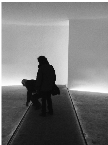
Figure 1 : Visiteurs dans « la banquise ».

Une grande attention est donnée aux espaces d'entrée de l'exposition, qui forment une succession de sas, opérant des passages à la fois physiques et symboliques. Empruntant un couloir sombre en courbe, les visiteurs débouchent sur une pièce ronde, au sol glacé, traversée par une passerelle de verre. Des néons dissimulés au bas des parois donnent à l'espace, une couleur bleutée lumineuse qui évoque la banquise. « L'impression lumineuse et la sensation de froid vous introduisent dans l'univers arctique blanc et glacé, dépourvu d'horizon » (guide d'exposition). Les visiteurs traversent lentement, souvent silencieusement ou en chuchotant; certains s'arrêtent pour poser leur main au sol pour en éprouver le froid mordant (fig. 1).