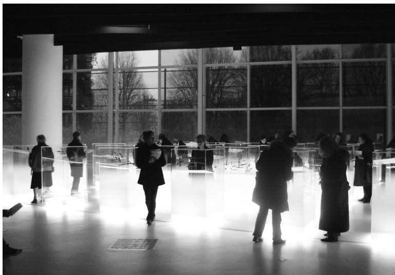
Figure 2 : Présentation des œuvres dans des cubes translucides.