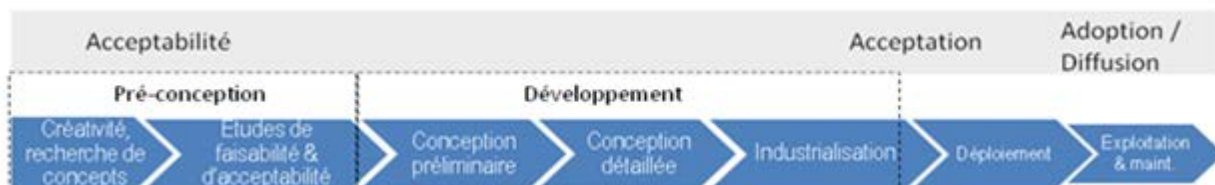
Figure 1. Processus de développement de nouveaux produits

Si on se réfère au processus de développement de nouveaux produits, la figure 1 ci-dessous présente les différentes étapes. Selon [Aoussat et al. , 2000], les décisions les plus importantes sont prises pendant la phase de pré-conception. En général, à l'issue de cette phase les chefs de projet doivent choisir parmi les alternatives de solutions celles qui vont être développées par la suite. C'est à ce niveau que des études de faisabilité économiques, techniques et d'acceptabilité sont à réaliser pour une bonne réussite des projets d'innovation.