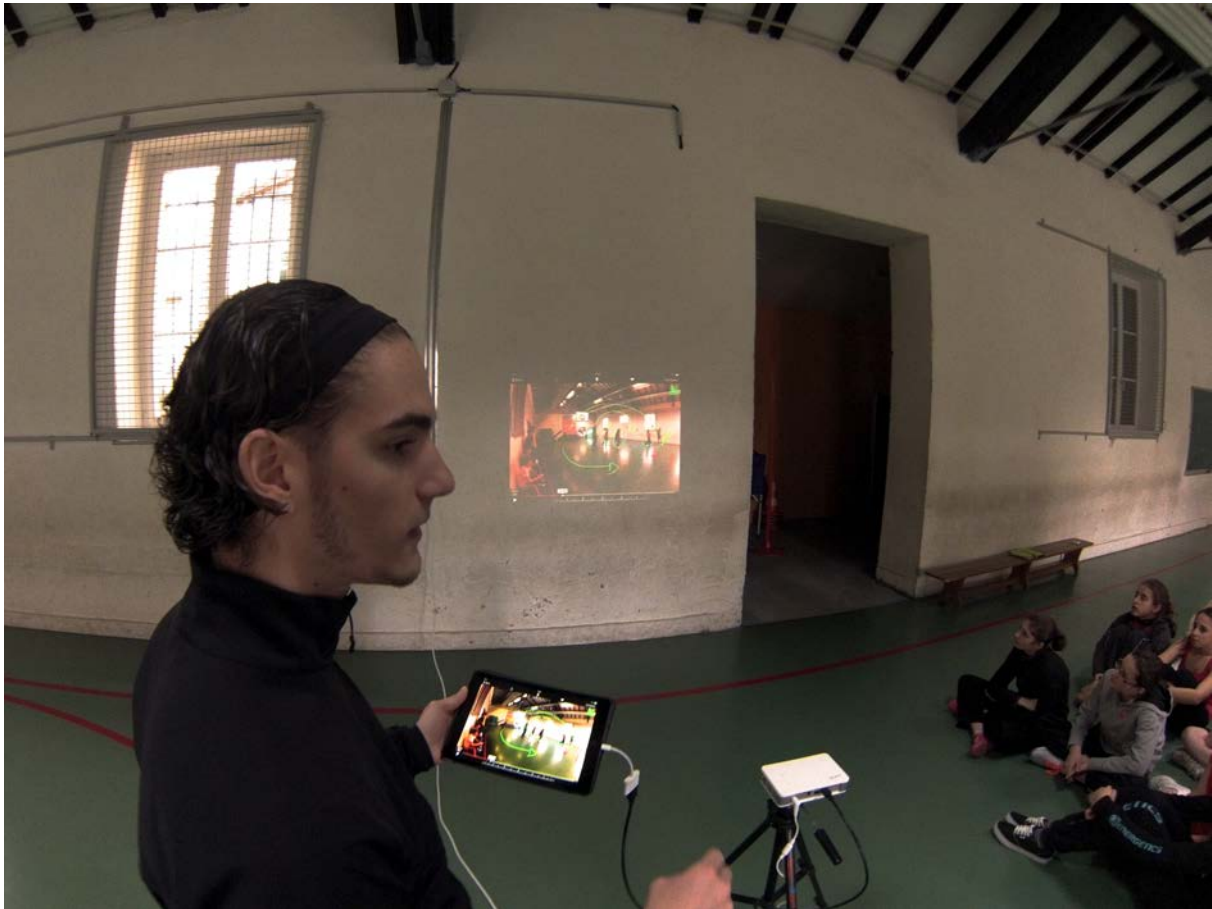
Utilisation du couplage iPad + pico-projecteur en cours d'EPS

Les interactions avec le groupe classe intégrant des retours d'images (photo ou vidéo) sont limitées par la taille des interfaces nomades, la taille des écrans des tablettes et des notebooks se situant entre 7 et 10 pouces (17 à 25 cm environ). Mais le récent développement des « pico-projecteurs » permet d'envisager un autre mode de diffusion des médias auprès des élèves et de dépasser cette limite. Les « pico-projecteurs » présentent les mêmes fonctionnalités que les vidéoprojecteurs utilisés en classe, avec une résolution de l'image (pixels), une luminosité (lumens) et un taux de contraste qui ne cessent de s'améliorer et qui permettent de s'en servir dans une salle éclairée. L'intérêt de ces matériels réside dans leur taille (7 à 12 cm de côté, pour 3 à 5 centimètres de hauteur), leur poids (200 à 500 grammes), la possibilité de fonctionner en autonomie, grâce à leur batterie et la possibilité de les fixer sur un trépied pour diriger et stabiliser l'image projetée. Ces caractéristiques permettent une mobilité intéressante pour l'enseignant, qui peut les transporter et les installer sur différents lieux de pratique. La connexion avec la tablette, le notebook ou la caméra embarquée, permet de combiner des produits nomades, peu encombrants, rapides à installer et particulièrement adaptés aux conditions d'enseignement de l'EPS.