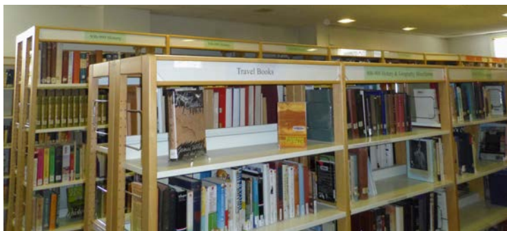
Illustration 16: Les récits de voyages mis en valeur en début de rayon, photographie PAR Marie HAMEL, 2015

signalétique en surmontant les étagères de ces livres de l'indication « Travel Books » soit l'équivalent anglais de « récits de voyage » afin d'être conforme à la signalétique anglaise de la BAN. L'emplacement est aussi intéressant du fait qu'il permet aux récits de voyages de jouxter les ouvrages traitant d'histoire et/ou de géographie, thématique généralement traitée dans ce genre de livres.