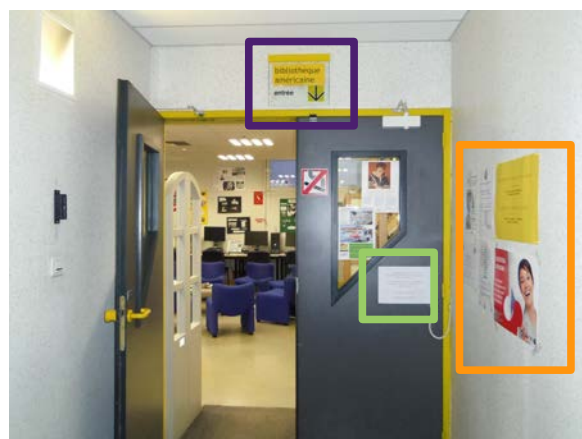
Illustration 2: Entrée de la BAN, photographie PAR Marie HAMEL, 2015

En ce qui concerne les panneaux, à l'entrée principale un ancien panneau indique encore la BAN à son emplacement d'origine dans le bâtiment à savoir à l'étage. Cette ancienne signalétique peut induire en erreur le visiteur. Toutefois, une affiche de la bibliothèque américaine indique la porte conduisant au sous-sol pour diriger les visiteurs nouveaux venus dans les locaux. Sur la porte d'entrée du bâtiment une feuille de format A4 indique en français qu'il faut sonner pour accéder à la bibliothèque. Il est dommage que cette feuille ne soit pas bilingue à l'image de tous les documents produits par la BAN, car certains usagers fréquentant la bibliothèque sont plus familiers avec l'anglais que le français. Le fait que le document n'ait été réalisé qu'en français, s'explique du fait