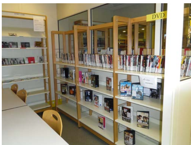
Illustration 12: Le bloc multimedia, photographie PAR Marie HAMEL, 2015

À côté du box references se trouve le box multimedia contenant à la fois les DVD et les livres audio. Ce box est matérialisé sur le plan par la pièce contenant les étagères de couleur violette. Les documents exposés dans ce box ne sont que des « fantômes »*, terme utilisé en bibliothèque pour décrire le système qui consiste à remplacer le vrai document par une reproduction informant le public sur l'existence du document à la bibliothèque. Au moment du prêt l'utilisateur présente le fantôme