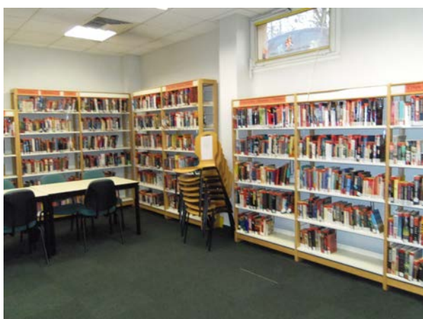
Illustration 13: L'espace consacré aux romans policiers, romans de mystères et thrillers à la BAN, photographie PAR Marie HAMEL, 2015

En plus d'être isolés du reste des romans et de bénéficier d'une salle à part – espace qui est également aménagé avec des tables et des chaises et pouvant servir de lieu de travail pour le public – les documents de science-fiction et les romans policiers bénéficient d'un code-couleur qui les rend plus facilement identifiables aux yeux des lecteurs. Si par exemple certains ouvrages de ces deux catégories sont isolés en tant que nouveautés ou dans le cadre d'une exposition temporaire, le public visualise rapidement grâce aux couleurs rouges ou bleues de leur cote à quels genres ces documents appartiennent. Ce code couleur rappelle également celui de la signalétique de la salle réservée à ces deux genres. Comme le montre l'illustration 13, le côté « Crime Fiction, Mysteries & Thrillers » est à dominante rouge grâce aux cotes et aux affiches surmontant les étagères, de la même manière que l'illustration 14 met en valeur la dominante bleue du côté « Science-Fiction, Fantasy & Horror ». Ce code couleur étant bien intégré au sein de la BAN, j'ai décidé de le reprendre lorsque j'ai réalisé le plan de la BAN, afin que si celui-ci venait à être affiché le public puisse y retrouver le code couleur qu'il connaît déjà.