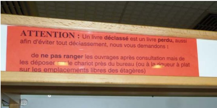
Illustration 17: Affiche placée sur les rayonnages pour informer le public du risque de déclassement des documents, photographie PAR Marie HAMEL, 2015

Dans l'étape de l'indexation* nous avons vu qu'il fallait attribuer au document une cote. Cette cotation est essentielle car elle permet de retrouver un document dans les collections à partir du catalogue. La cote permet également aux bibliothécaires de savoir où ranger un document au moment du retour. D'ailleurs lorsque les usagers reposent un document sans prêter attention à la