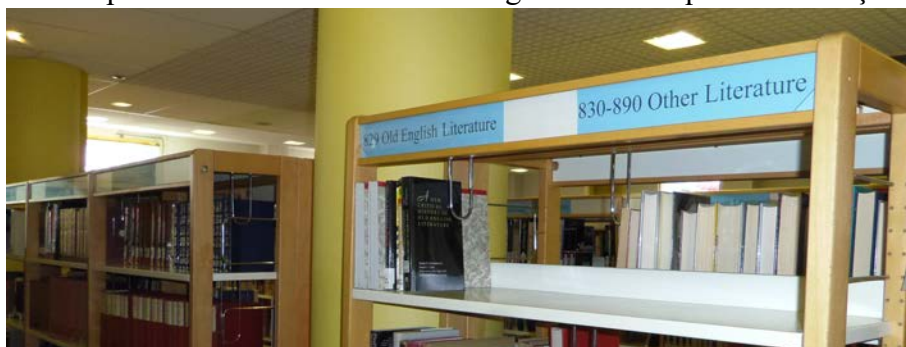
Illustration 11: Exemple de signalétique dans le rayon littérature, photographie PAR Marie HAMEL, 2015

miscellanies peut dérouter un lecteur qui ne saurait pas qu'il signifie « généralités ». Ayant retravaillé sur la signalétique des rayons histoire, géographie et littérature, j'ai envisagé la possibilité de faire cette signalétique en bilingue, mais j'ai constaté que certains titres seraient trop longs. J'ai préféré détailler au sein d'un même domaine les différentes catégories comme par exemple « littérature américaine » au sein du domaine « littérature ». Ces titres plus précis occupent de l'espace et celui disponible au dessus des rayonnages est limité. Parfois un rayonnage contient plusieurs catégories. L'illustration 11 montre l'exemple d'une étagère partageant deux sous-catégories Old English Literature c'est-à-dire « Littérature en vieil anglais » et Other Literature c'est-à-dire « Autres littératures ». Si les titres avaient été en bilingue, il aurait fallu rétrécir les caractères de moitié pour faire tenir les deux titres dans l'espace disponible. J'ai privilégié l'uniformité des titres dans la zone documentaire et ai estimé que les titres en anglais se comprenaient assez bien sans avoir un niveau d'anglais très élevé. Il sera toujours possible après de faire une affiche récapitulante à la fois les titres en anglais et leur équivalent français.