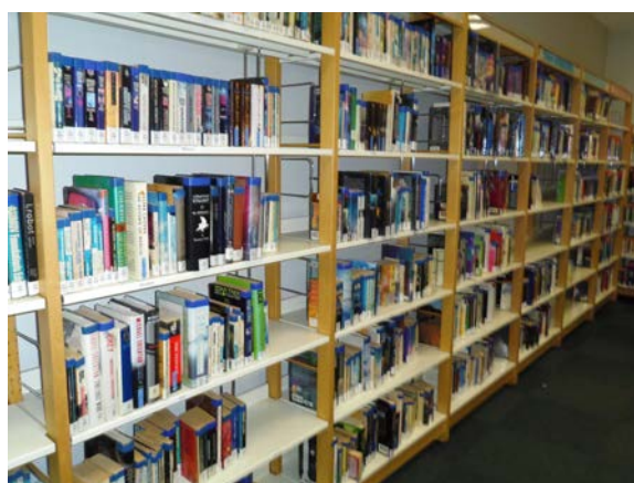
Illustration 14: L'espace consacré à la science-fiction, la fantaisie et les romans d'horreur à la BAN, 2015