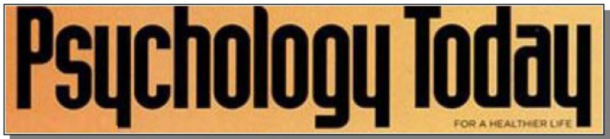
Illustration 10: Aperçu d'un exemple de titre de magazine utilisé pour la signalétique de l'espace périodique de la BAN, photographie PAR Marie HAMEL, 2015