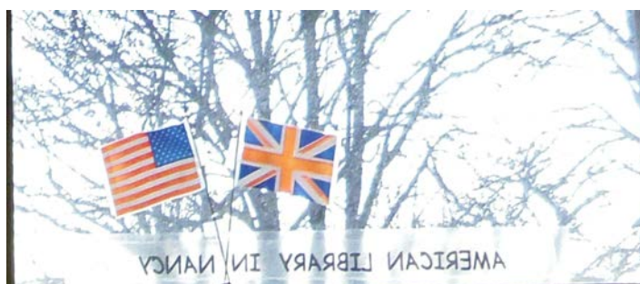
Illustration 1: Fenêtre de la BAN vue de l'intérieur de la bibliothèque, photographie PAR Marie Hamel, 2015

Pour ce qui est de l'accessibilité en elle-même aux locaux, chacun peut facilement se rendre à la BAN, y compris les personnes à mobilité réduite. En effet, bien que les locaux de la BAN soit situés au sous-sol du bâtiment et que la plupart du temps les usagers empruntent un escalier pour y accéder, un ascenseur est à la disposition du public, permettant ainsi l'accès du lieu aux personnes handicapées comme aux mamans accompagnées de jeunes enfants en poussette.