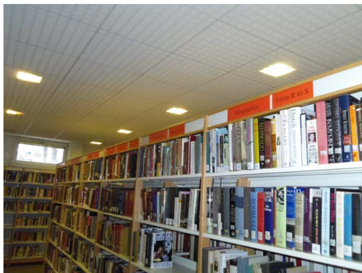
Illustration 15: Le rayon des biographies et sa signalétique, photographie PAR Marie HAMEL, 2015

« Biographies » et « Biographical dictionaries » correspondant aux dictionnaires biographiques et j'ai accompagné ces pancartes d'affiches indiquant les lettres des personnages dont la biographie était présente sur l'étagère en question. Par exemple l'une des étagères visibles sur l'illustration 15 porte la mention « from R to S » indiquant que les noms des personnages traités dans les biographies sur ces étagères commencent par la lettre R ou