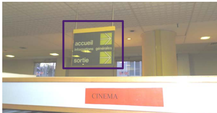
Illustration 4: Panneau de signalétique dans la BAN, photographie PAR Marie HAMEL, 2015

Dans les locaux, j'ai observé la présence d'un seul panneau de signalétique. Ce dernier est placé au dessus d'un rayon de documentaires et indique la direction de l'accueil et de la sortie. Ce panneau est visible sur l'illustration 3 dans le rectangle violet. S'il paraît