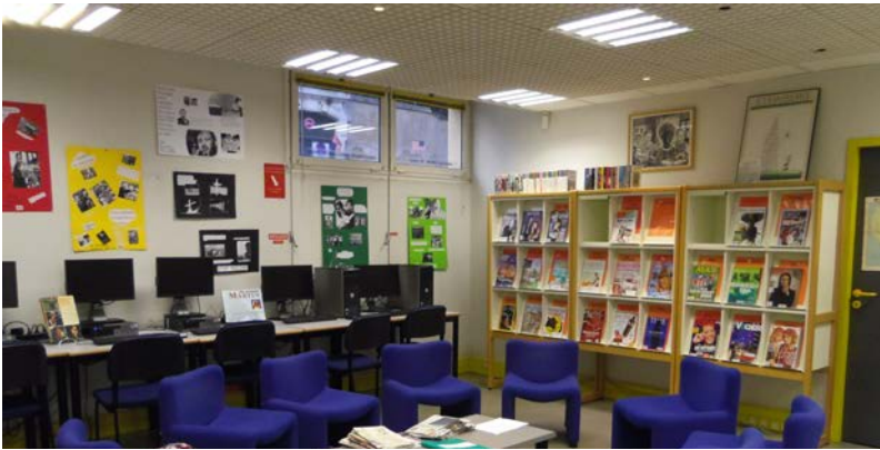
Illustration 9: Espace réservé aux périodiques à la BAN, photographie PAR Marie HAMEL, 2015

L'espace réservé aux périodiques est représenté en orange sur le plan en annexe. Il est également situé directement dans l'entrée de la bibliothèque à proximité des ordinateurs. Comme le montre l'illustration 9, les périodiques sont situés à côté d'un espace de lecture. Cet espace