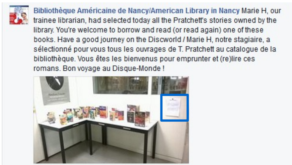
Illustration 8: Commentaire d'une publication Facebook du 13 mars 2015 sur la page de la BAN, capture d'écran PAR Marie HAMEL, 2015