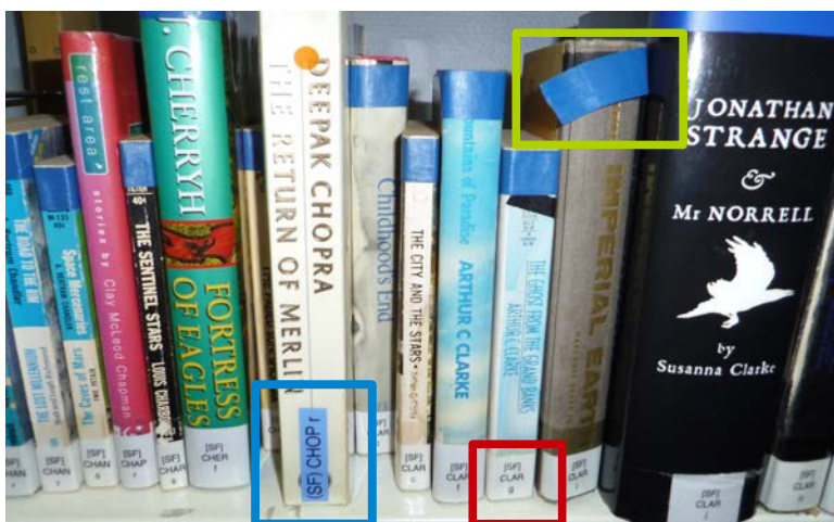
Illustration 3 : Exemple de non uniformité des cotes, photographie PAR Marie HAMEL, 2015

exceptionnelle de la bibliothèque. Sa position sur la porte permet d'attirer le regard des visiteurs. Contrairement aux autres feuilles d'information, cette dernière n'était destinée à être affichée que les quelques jours précédant la fermeture et le jour-même de la fermeture de la bibliothèque. Deux autres feuilles, concernant la fermeture exceptionnelle de la