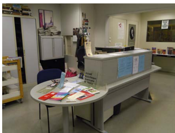
Illustration 18: Le bureau d'accueil de la BAN, lieu central du service public, photographie PAR Marie HAMEL, 2015

De septembre 2013 à octobre 2014 la BAN a enregistré dix mille sept cent vingt-trois entrées, ce qui représente cinq cent vingt-neuf entrées de plus que l'année précédente, soit une hausse de cinq pour