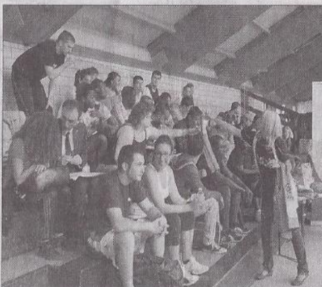
■ Les étudiants lors de la présentation du dispositif de recrutement.