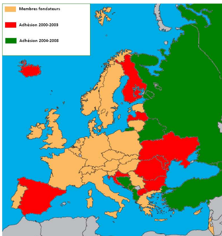
Figure 1. Carte des adhésions à l'EUSA

Il est intéressant de noter qu'une des premières problématiques soulevée lors de la création de l'EUSA a été celle de son intégration dans un système mondial déjà fortement structuré. Ainsi « ne pas entrer en compétition avec la Fédération Internationale du Sport Universitaire (FISU) » et « ne pas donner l'impression de vouloir exclure les activités sportives non-européennes » ont été des notions cadres pour la définition des premières activités de l'EUSA (cf. annexe 2, p1).