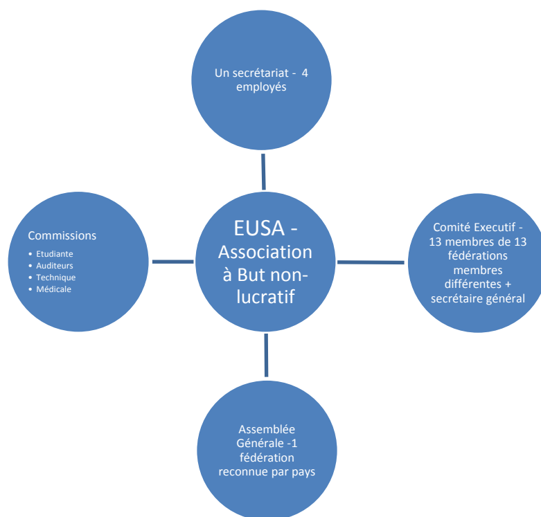
Figure 2. Schéma récapitulatif de la structure de l'EUSA

Elle comprend quatre organes principaux :