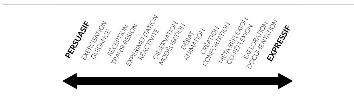
Figure 3 : le continuum expressif-persuasif des jeux vidéo

Ainsi, ces outils que nous proposons dépassent les dénominations d' expressive games (Genvo, 2013) et de persuasive games (Bogost, 2006). Ils permettent selon nous une plus grande finesse d'analyse (1) des objectifs fixés ou supposés du play design et (2) des stratégies mises en place par ce dernier pour que le ou la joueuse les atteigne (figure 3). Dans la partie suivante, nous allons appliquer ces outils à The Witness .