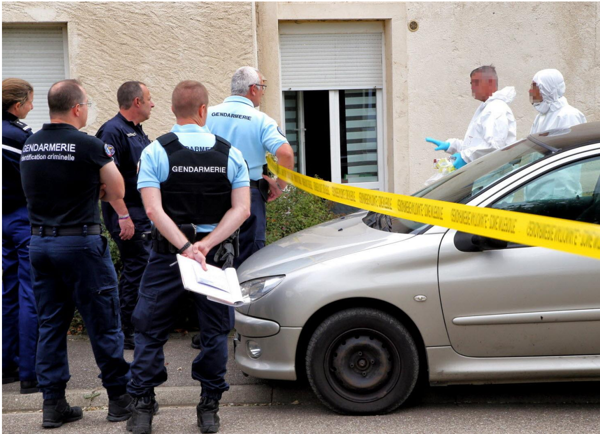
Photographie prise par Le Républicain Lorrain le 6 septembre 2017 et publiée dans l'édition du 7 septembre

personnage du journaliste n'engage pas néanmoins à transmettre une interprétation précise au joueur (la figure fictionnelle du journaliste étant davantage une interférence interprétative pour qui connaît le film). Mais cette interférence donne au joueur un espace d'appropriation possible quant à la signification qu'il pourra prêter à la situation.