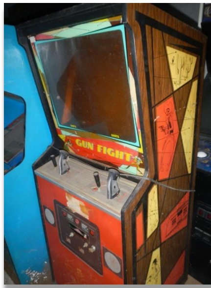
La cabine de Gunfight (1975, Midways Game)

L'étude des premiers jeux vidéo est à ce titre particulièrement éclairante pour mettre en évidence ces processus de médiation fictionnelle, en ce que les limitations techniques de l'époque imposaient un rendu graphique minimaliste et que le caractère ludique de ces productions était loin d'être intégré et accepté par le public visé. En somme, il fallait mettre en œuvre des marqueurs pragmatiques de fiction particulièrement explicites pour inciter le joueur à voir autre chose qu'un amas de pixels animés à l'écran. Les bornes d'arcade, disponibles dans les salles d'arcade, les cafés ou environnements forains, présentaient un cadre physique de fictionnalisation à travers les visuels peints sur leurs cabines. Le cas de la cabine d'arcade du jeu Gunfight (1975) est par exemple particulièrement probant. Ce jeu propose à deux joueurs un duel de western. Alors que les graphismes sont très rudimentaires dans leur représentation et ne permettent pas d'afficher de décors (seuls les personnages et une diligence apparaissent), la cabine du jeu renvoie directement à la conquête de l'ouest à travers ses illustrations et ses joysticks en forme de crosse de revolver. De nombreux éléments liés au jeu, comme les « arcades flyers » 19 (destinés à la promotion des bornes d'arcade) renforcent d'ailleurs cet ancrage avec une iconographie typique de la conquête de l'ouest (présence d'une cariole, d'un cactus et bien sûr d'un duel au revolver entre deux cowboys).