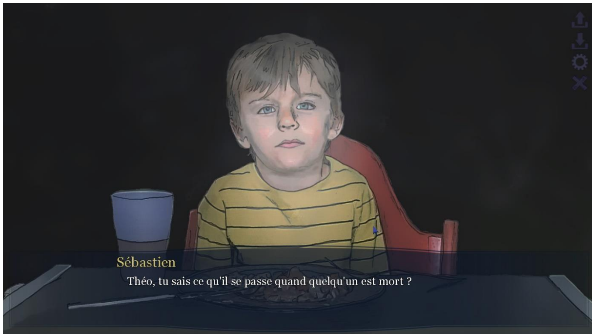
Séquence de Lie in my heart où l'on doit annoncer le décès à l'enfant

Dès lors, l'une des questions qui se pose dans le projet Lie in my heart est de savoir comment modéliser la distance que comportent les espaces d'appropriation soumis aux joueurs ? Une solution mise en œuvre au niveau des marqueurs pragmatiques de la fiction a été de créer des interférences interprétatives. Cela permet d'étendre la part de virtuel à explorer, en incluant d'autres systèmes signifiant dans la distance créée. Comme l'indique Sébastien Babeux,