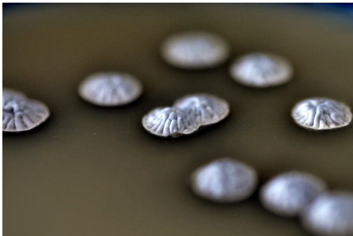
Quelques colonies de bactéries du sol ( Streptomyces ) productrices d'antibiotiques.

Les bactéries qui sont exploitées pour produire une grande partie des antibiotiques, anticancéreux et antiviraux appartiennent à un seul genre vivant dans le sol ( Streptomyces ). Elles constituent un réservoir inépuisable d'antibiotiques appartenant à toutes les familles chimiques et visant toutes les cibles cellulaires imaginables aujourd'hui. Cependant, synthétiser un antibiotique sans être capable d'y résister reviendrait à se faire harakiri . Ces mêmes bactéries possèdent donc un arsenal de résistances c'est-à-dire produisent un antidote pour chaque molécule antibiotique qu'elles synthétisent.