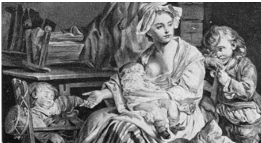
"Le silence" ou "ne l'éveillez pas" , gravure de Laurent Cars d'après Greuze, détail, paru dans " cent mille ans de vie quotidienne ", - collection panorama d'histoire , édition du Pont Royal, Paris, 1960, gravure n° 537.

Au XVIII e siècle, ces représentations finissent par disparaître au profit de représentations quotidiennes des mères qui allaitent, dont les peintres firent de nombreux portraits au XVIII e et XIX e siècle. (29)