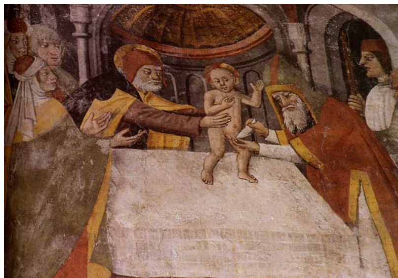
La Circoncision de Jésus fresque de Jean Canavero, XVe siècle, église Notre-Dame-des-Fontaines.

A la naissance du Christianisme , la circoncision est obligatoire et Jésus la subit donc, de nombreux peintres s'en sont inspirés pour leurs œuvres. Ce n'est que 30 ans après sa mort que le Christianisme fut divisé en deux : d'une part les judéo-Chrétiens qui continuèrent à pratiquer la circoncision et à respecter la Loi. D'autre part, les greco-Chrétiens ou papaux-Chrétiens, païens christianisés, qui rejetèrent la circoncision et s'écartèrent de la Loi. C'est ainsi qu'après un demi-siècle d'existence les Chrétiens abandonnèrent la circoncision. (18)