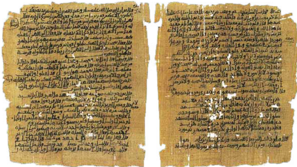
"Le plus ancien codex sur papyrus connu : Wahb ibn Munabbih, Hadīth Dāwūd (Histoire de David) et biographie du Prophète. Égypte, IXe siècle. Papyrus. Heidelberg, Institut de Papyrologie (papyri Schott Rheinhartd 23)

On retrouve, tout comme dans la Bible, des versets appelés ayats , au cœur de chapitres appelés sourates , dans de grandes parties appelées juz' . Le Coran dénombre 114 sourates comportant entre 3 et 286 ayats . Et concernant les juz' il en existe 30, une par jour du mois. Ainsi pendant le ramadan, chaque jour, on lit une juz' .