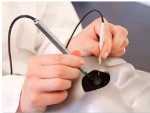
Tête du mannequin avec insertion des deux instruments (vitréotome et lumière).