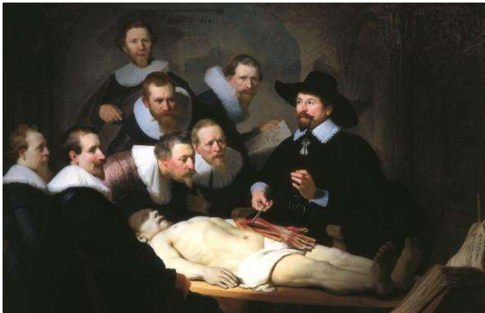
La Leçon d'anatomie du docteur Tulp, peinture de Rembrandt

La plus ancienne est la dissection sur cadavres, qui a débuté en Egypte antique, puis s'est développée à partir de la Renaissance jusqu'à nos jours (1). Cette pratique est à l'heure actuelle de moins en moins répandue en France, en raison d'une législation assez stricte. En effet, jusqu'au début des années 1950, les cadavres de suppliciés et des morts abandonnés fournissaient majoritairement le matériau essentiel de toute dissection. Depuis lors, seules les personnes ayant fait don de leur corps à la science sont éligibles à la dissection (2), ce qui a considérablement réduit cette pratique.