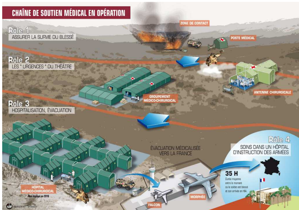
Figure 1 : Chaîne du soutien médical en opération

de matériels, consommables et médicaments, auquel peuvent s'ajouter des lots complémentaires selon les besoins de la mission.