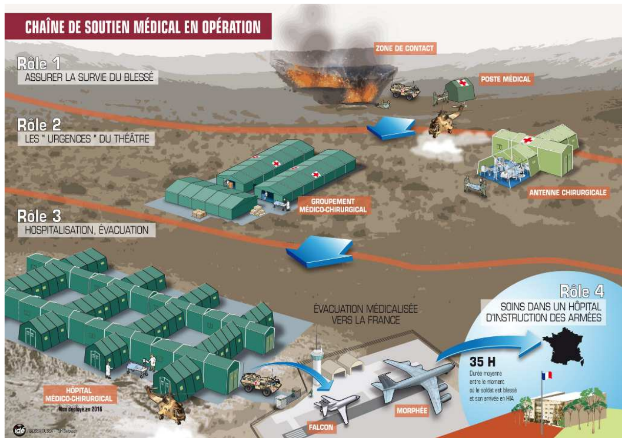
Figure 1 : Chaîne du soutien médical en opération

de matériels, consommables et médicaments, auquel peuvent s'ajouter des lots complémentaires selon les besoins de la mission.