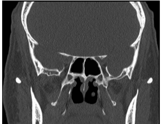
Figure 1 : Scanner des sinus en coupes coronales d'un patient souffrant de polypose nasale débutante (stade II). A noter l'absence d'opacité des sinus maxillaire, frontal et sphénoïde.